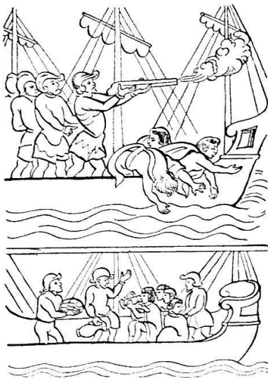
Die erste Begegnung zwischen Cortés und den Gesandten Moctezumas nach dem Codex florentinus

«Sehr entsetzte es ihn, als er hörte, wie herabfällt ihr Befehl, das Feuergeschütz, wie er donnert, der Schall, wenn er fällt, zum Ohnmächtigwerden, zum Taubwerden. Und wenn der Schuss fällt, wie eine Kugel aus seinem Bauch herauskommt, Feuer regnend, sehr stinkend, nach Schwefel stinkend, dass es einem den Kopf benimmt. Und wenn die Kugel einen Berg trifft, wie er da zusammenstürzt, in Trümmern liegt. Und wenn sie einen Baum trifft, so wird er zerpulvert, wie wenn einer etwas Unerhörtes vorführt, als wenn einer ihn fortgeblasen hätte. Lauter Eisen ist ihre Kriegstracht, in Eisen kleiden sie sich, mit Eisen bedecken sie ihren Kopf, aus Eisen besteht ihr Schwert, aus Eisen ihr Bogen, aus Eisen ihr Schild, aus Eisen ihre Lanze. Und ihre Hirsche tragen sie auf dem Rücken, dachhoch sind sie dadurch [...] Einige sind kraus, gelockt, und ihre Speise, wie Fürstenspeise, gross, weiss, nicht schwer, wie Spreu, wie Maisstengel, wie gemahlene Maisstengel, etwas süss, etwas honigsüss, nach Honig, nach Süssem schmeckend. Und ihre Hunde, sehr gross, mit gefalteten Ohren, mit grossen, hängenden Lefzen, mit feurigen, mit flammenden Augen, mit hellen, gelben Augen, mit eingezogenem Bauch, mit ausgekehltm Bauch, mit löffelförmigem Bauche; ausgewachsen sind sie wild, wie Unholde, immer keuchend, immer mit heraushängender Zunge, jaguarfleckig, gefleckt.» 12