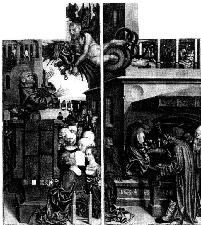
Image 1: Hans Fries, extrait de l'image du retable Saint Antoine, Eglise des Cordeliers, Fribourg

n'est pas à discuter ici. Plus important pour notre thématique est le résultat de ses recherches qui montre que Vincent Ferrer, outre à défendre la légitimité du pape Benoît XIII contre les prétentions du pape résidant à Rome, insistait à défendre toute perception des intérêts au capital prêté. Frédéric d'Amberg, originaire du couvent du lieu de ce nom, situé en Palatinat supérieur, et guardian du couvent franciscain de Fribourg au début du XVe siècle fit une transcription de ses sermons qui dut servir de modèle à suivre par d'autres prédicateurs. 23