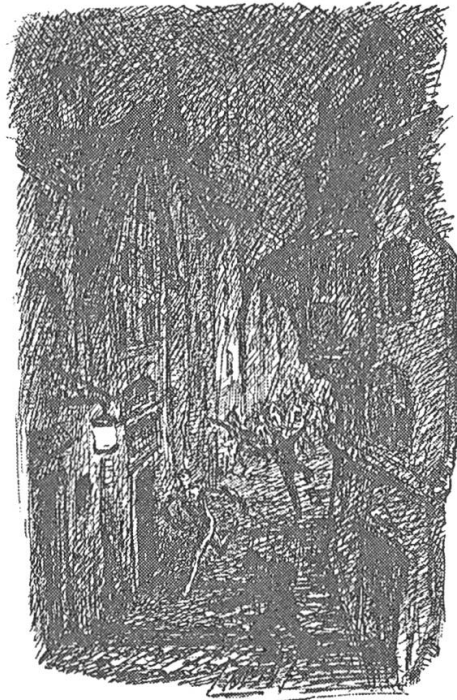
Abb. 1: Alfred Kubin, Die andere Seite, 1909, Reprint 1990, 127.

Eine böse, mit unheilvoller Geschichte gesättigte Architektur dominiert die Traumstadt. Der Herrscher Patera hat für Perle solche Häuser ausgesucht, die «von Verbrechen, Blut und Gemeinheit besudelt» (173) sind. Sie beherbergen, was längst vergangen ist. Ihre Gleichzeitigkeit, die sie im Heute zugleich das Gestern sein lässt, haucht ihnen ein unheimliches Leben ein. Der Blick wird umgekehrt: Die Gebäude blicken die Menschen an – und es ist kein freundlicher Blick, den sie auf ihre Erbauer werfen.