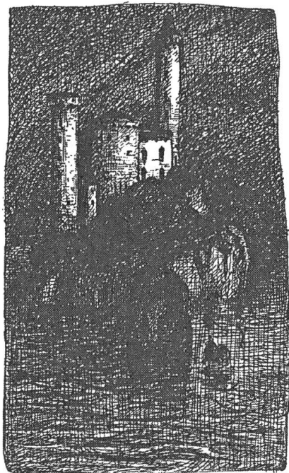
Abb. 6: Alfred Kubin, Die andere Seite, 1909, Reprint 1990, 269 (Pateras Palast).

«Über der ganzen Stadt gleichsam hängend und sie beherrschend erhob sich ein monströser Bau in ungeschlachter Größe. Drohend blickten die hohen Fenster weit über das Land und auf die Menschen da unten. An den porösen, verwitternden Fels sich lehnd, schob er seine Massen bis an das Zentrum der Stadt, den großen Platz vor.» (59)