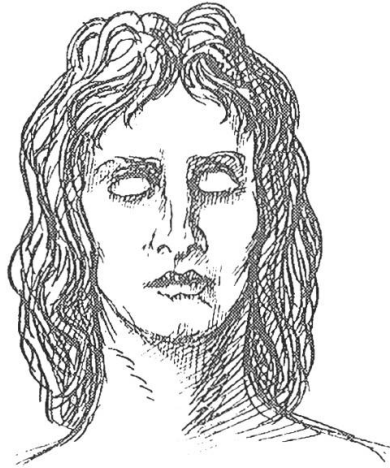
Abb. 2: Alfred Kubin, Die andere Seite, 1909, Reprint 1990, 335 (Patera).

Im Unterschied zu zeitgenössischen Stadtuntergangsszenarien ist Perle nicht historisch gewachsen, sondern die Schöpfung von Patera, dem Herrn und Vater der Stadt. Die zeichnerische Darstellung Pateras evoziert die Ikonographie von Christus, doch die geschlossenen Augen weisen ihn als Träumer aus.