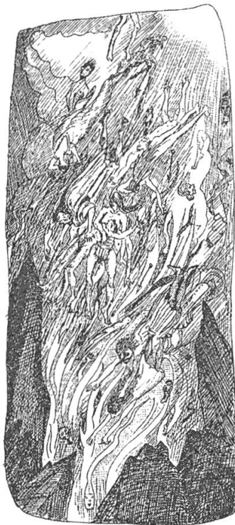
Abb. 7: Alfred Kubin, Die andere Seite, 1909, Reprint 1990, 317 (Höllenstein).

gesetzt, Kontrolle und Steuerung ausgeschaltet. Mit den beiden Führerfiguren – Patera, der entsprechend dem Max Weberschen Schema 14 den traditionellen, religiös legitimierten, und Bell, der den rationalen, ökonomisch-kapitalistisch legitimierten Herrschaftstypus repräsentiert – verhandelt der Roman die Frage nach der «wahren Regierung». Das Resultat ist ein beiderseitiges Fiasko. Ebenso am Ende ist aber auch die charismatische Herrschaftsform, auf die beide Kontrahenten rekurrieren, wobei die Aura des unsichtbar bleibenden Patera nachhaltiger wirkt als die des triumphal auftretenden Bell. Gerade dessen Versuch, die Dekadenz durch rationalen Ordnungswillen zu überwinden, führt zur Beschleunigung des Untergangs. Nicht zufällig erinnert Bell, der auf einem schwarzen Pferd durch Perle prescht, an einen apokalyptischen Reiter. In der destruktiven Kraft des technischen Fortschritts enthüllt sich dieselbe atavistische Archaik, die eben dieser Fortschritt zu beseitigen vorgibt. Bell ist nichts anderes als Produkt und Maske Pateras.