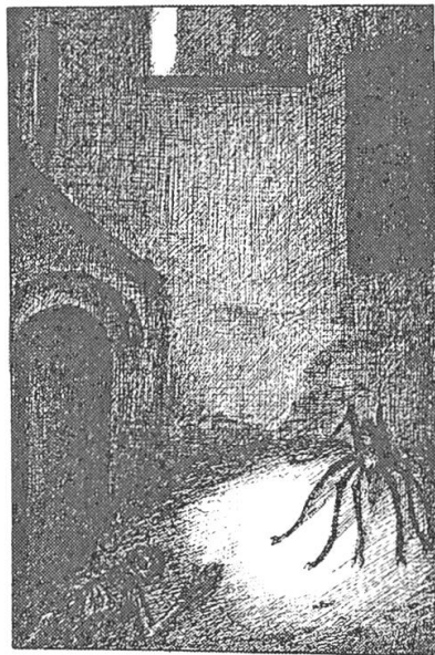
Abb. 8: Alfred Kubin, Die andere Seite, 1909, Reprint 1990, 259.

Architektonische Räume sind bei Kubin nicht nur Metaphern des apokalyptischen Geschehens, sondern sie durchziehen, gestalten und strukturieren es. Architektur ist eingebunden in einen beweglichen und veränderlichen, erlebten und gestimmten Raum; sie ist Produkt einer Traumarbeit, die den Raum dynamisiert und entgrenzt.