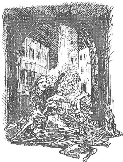
Abb. 4: Alfred Kubin, Die andere Seite , 1909, Reprint 1990, 305 (Leichenkaskade).

Eine formlose, mit den Dingen verschmolzene Menschenmasse 11 reagiert auf den Untergang der Stadt mit ausgelassener Lust und enthemmter Gewalt – oder sie verfällt einer unbändigen, sich seuchenartig verbreitenden Schlagsucht, welche die Kardinalsünde der acedia evoziert. Die bacchantische Entfesselung der Triebe, Orgien, Massenvergewaltigungen, blutige Aufstände, Kannibalismus, Massenselbstmorde und das «Überhandnehmen der Tiere» (196) gemahnen an die apokalyptischen Plagen und verwandeln die Stadt in einen «gigantische[n] Müllhaufen» (279).