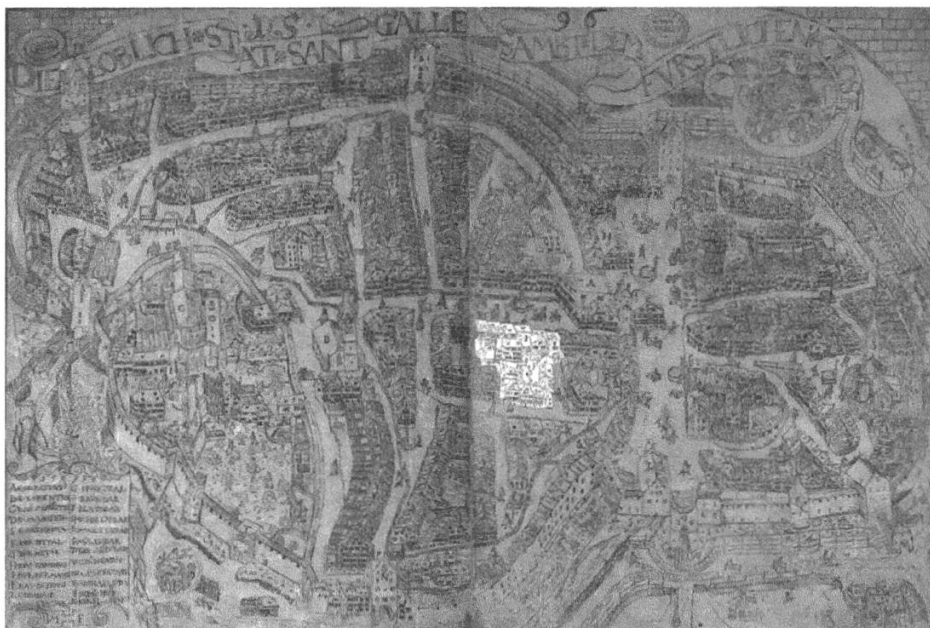
Abbildung 1: Auf dem Stadtplan von Melchior Frank aus dem Jahr 1596 ist der Häuserkomplex des Heiligeistospitals St. Gallen hell hervorgehoben. Das Spital St. Gallen entsprach mit 120 bis 300 Personen dem Typus eines Grosshospitals. Stadtarchiv der Ortsbürgergemeinde St. Gallen, Planarchiv, S 2, 1.

Schliesslich fanden auch Waisen und Wöchnerinnen Aufnahme. Städtische Spitäler dienten auf diese Weise der Fürsorge in einem umfassenden Sinne.