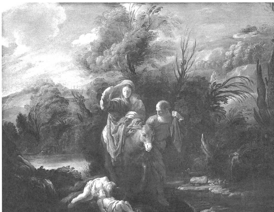
Abbildung 1: Domenico Fetti (1589–1624), Flucht nach Ägypten, um 1622/23, Öl auf Pappelholz, 63x80,5 cm, Kunsthistorisches Museum Wien, Gemäldegalerie.

einem Bild des Barockmalers Domenico Fetti aus dem Jahr 1622/23 beispielsweise liegen am Wegesrand der flüchtenden Heiligen Familie zwei bleiche Leichname getöteter Kinder ( Abb. 1 ). 15 Sie symbolisieren die tödliche Gewalt, der das Jesuskind und die Heilige Familie nur durch Flucht entgangen sind und die diese begründet und rechtfertigt. Das Bild visualisiert die beiden Optionen von Tod und Leben, zwischen denen die Flucht liegt. 16