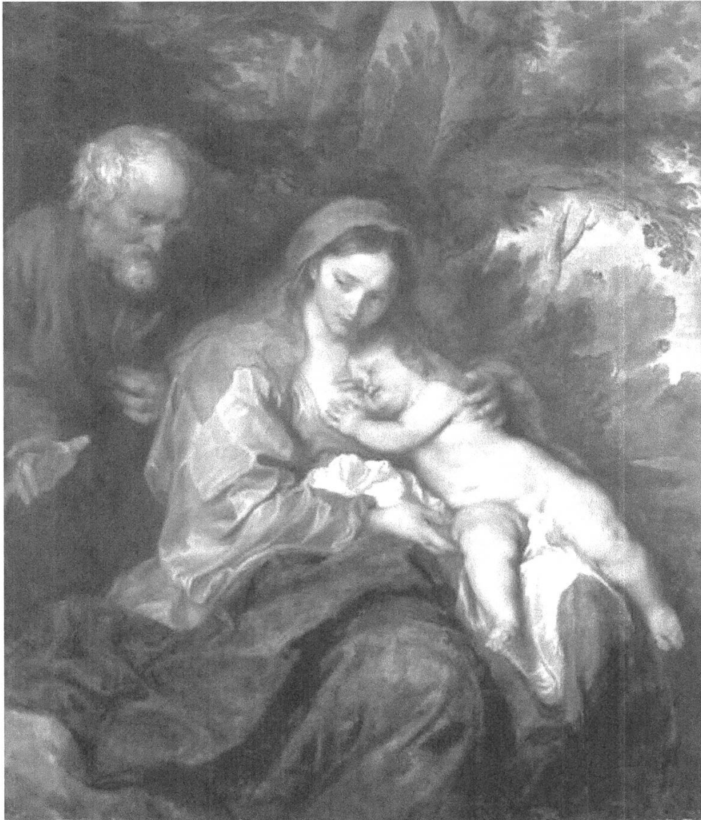
Abbildung 2: Anthonis van Dyck (1599–1641), Ruhe auf der Flucht nach Ägypten, um 1627/32, Öl auf Leinwand, 134,7x114,8 cm, via Wikimedia Commons, www.commonswikimedia.org/wiki/File:Anthonis_van_Dyck_048.jpg .

Dies galt um so mehr für den binnenkirchlichen Bereich der christlichen Konfessionen, die in der ‹Willkommenskultur› 2015 eine wesentliche Rolle bei der Aufnahme und Betreuung von Flüchtlingen spielten. Ihnen war nicht nur das christliche Bilderrepertoire noch stärker vertraut, für sie waren auch die sich daran anknüpfenden ethischen Narrative oftmals von besonderer Bedeutung.