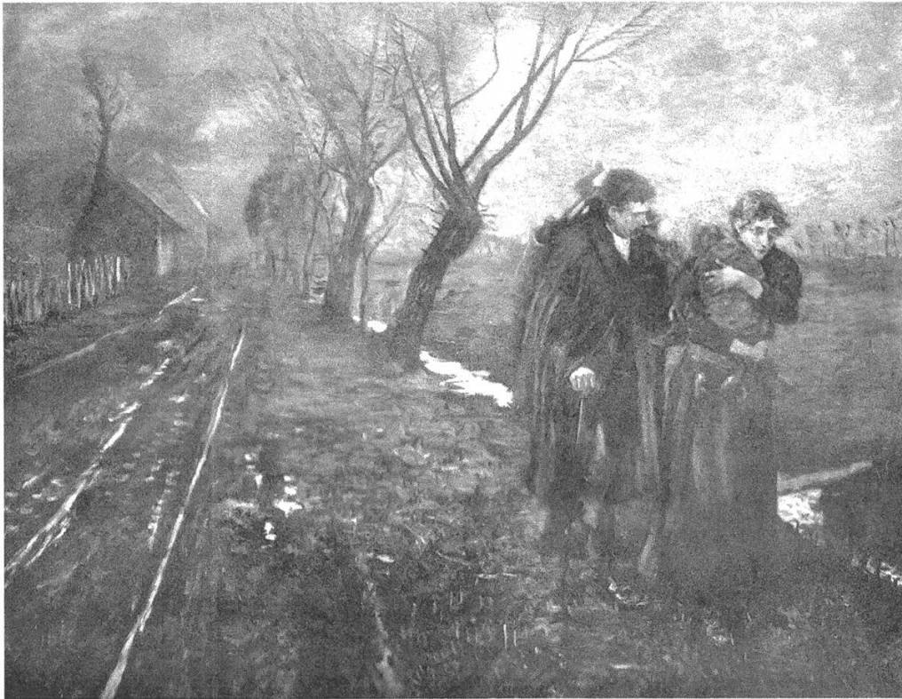
Abbildung 3: Fritz von Uhde (1848–1911), Die Flucht nach Ägypten , 1891, Öl auf Leinwand, 112×140 cm, aus: Hans Rosenhagen, Uhde. Des Meisters Gemälde in 185 Abbildungen , Stuttgart 1908, 113.

Uhde profanisierte und individualisierte die Heilige Familie radikal als obdachlose Handwerkerfamilie der damaligen Gegenwart «jenseits poetischer Verklärung in der Situation proletarischer Existenznot». 31 Damit erschloss er die alltägliche Not sozialer Unterschichten durch die Aura der biblischen Geschichte einer mitfühlenden Perspektive, die das christliche Gewissen und Verantwortungsbewusstsein sensibilisieren und herausfordern sollte, indem sie die religiöse Botschaft mit christlicher Sozialethik verband. 32 Diente damals eine derartige Visualisierung der Heiligen Familie auf der Flucht als Impuls für eine anteilnehmende Haltung gegenüber den Benachteiligten der Gegenwart, so knüpften