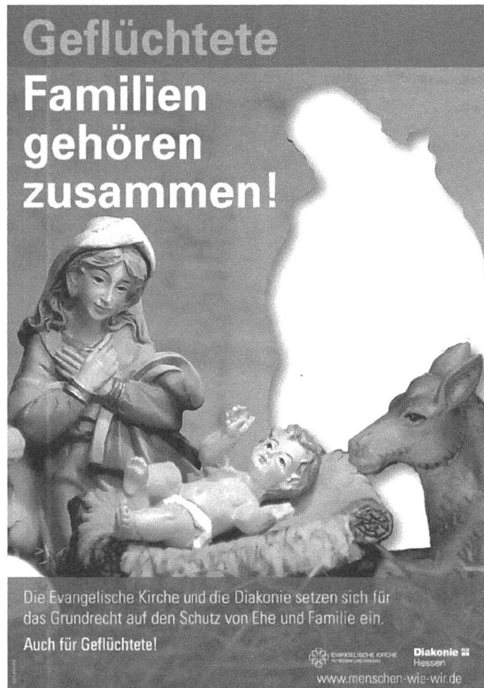
Abbildung 6: Plakat der Evangelischen Kirche in Hessen und Nassau und der Diakonie Hessen, Dezember 2017

te wandte. 44 Die Postkarten und Plakate zeigten eine Weihnachtskrippe mit der Heiligen Familie, wobei eine der drei zentralen Figuren (Maria, Josef oder das Jesuskind) aus dem Bildensemble entfernt war und nur eine weiße Lücke hinterlassen hatte. Überschriften war das Bild mit dem Schriftzug «(Geflüchtete) Familien gehören zusammen!»