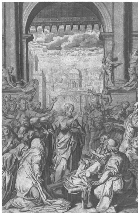
Abb. 5: Nach Federico Zuccari, Die Heilung des Gichtbrüchigen, Gravierung, 268 x 426 mm, ca. 1590–1599, Pinacoteca Repposi, Chiari BS.