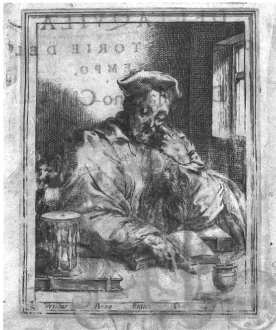
Abb. 1: Porträt Bernardino Cirillos , in: B. Cirillo, Annali della città dell'Aquila , Rom: app. Giulio Accolto 1570, c. 1v (Bayerische Staatsbibliothek, München).

Wiederauferstehung des Lazarus und Federico Zuccaris Heilung des Gichtbrüchigen (Abb. 4 & 5) im Dom von Orvieto, die der Maler aus Forlì von seinem Aufenthalt in Umbrien in den späten 1560er Jahren gekannt haben musste, abgeleitet zu haben. Mit seinem ausgestreckten rechten Arm bietet Christus im Bildvordergrund der zurückgelehnten Figur des Kranken Unterstützung, um sich zu erheben. Das fertiggestellte Altarbild zeigt eine Kurzfassung der in der Zeichnung noch präsenten Architekturkulisse. Damit beabsichtigte Agresti, die Wechselbeziehung zwischen Christus und dem Gichtbrüchigen bildrhetorisch noch stärker zu betonen. Die Zeichnung offenbart aber auch, dass der Maler die Szene ursprünglich als ein kollektives Ereignis mit mehreren Beobachtern und Zeugen konzipierte als das fertiggestellte Altarbild. Eine Figur in der linken Bildhälfte hinter dem Gelähmten, die für das ausgeführte Altarbild beibehalten wurde, legt seine Hände in demütiger Haltung auf seine Brust, um darauf hinzuweisen, dass er selbst von der wundersamen Heilung Christi berührt wurde. Der weisse Kragen sowie die schwarze Bekleidung erlauben es, diese Figur mit dem commendatore von Santo Spirito in Sassia, Bernardino Cirillo, zu identifizieren.