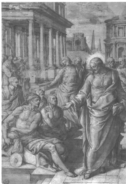
Abb. 3: Livio Agresti, Jesus heilt einen Paralytiker, Federzeichnung, 42.9 x 29.2 cm, ca. 1573–1575, Gabinetto Disegni e Stampe degli Uffizi, Florenz.