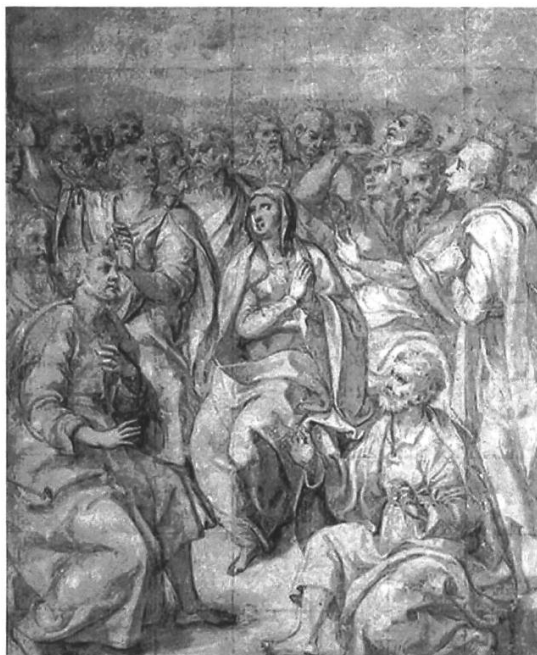
Abb. 2: Girolamo Siciolante da Sermoneta, Pfingstwunder, Zeichnung, ca. 1560, Département des Arts Graphiques, Musée du Louvre, Paris (Inv.-Nr.: 10197r).