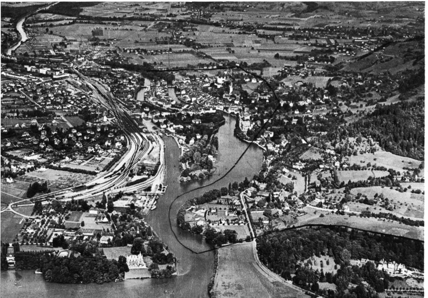
Fliegerbild von Thun. Grenze des Freigerichts „zur Lauenen“.