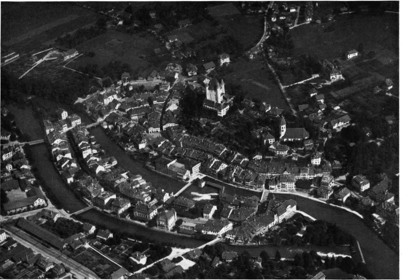
Fliegerbild von Thun. Alter Stadtkern.