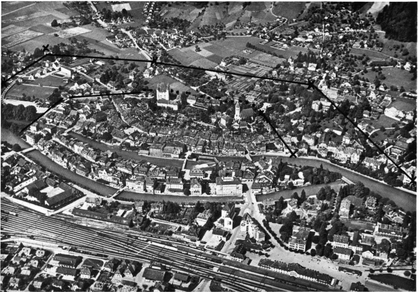
Fliegerbild von Thun. Stadtgrenze, Stadtmauer und Burgernziel.