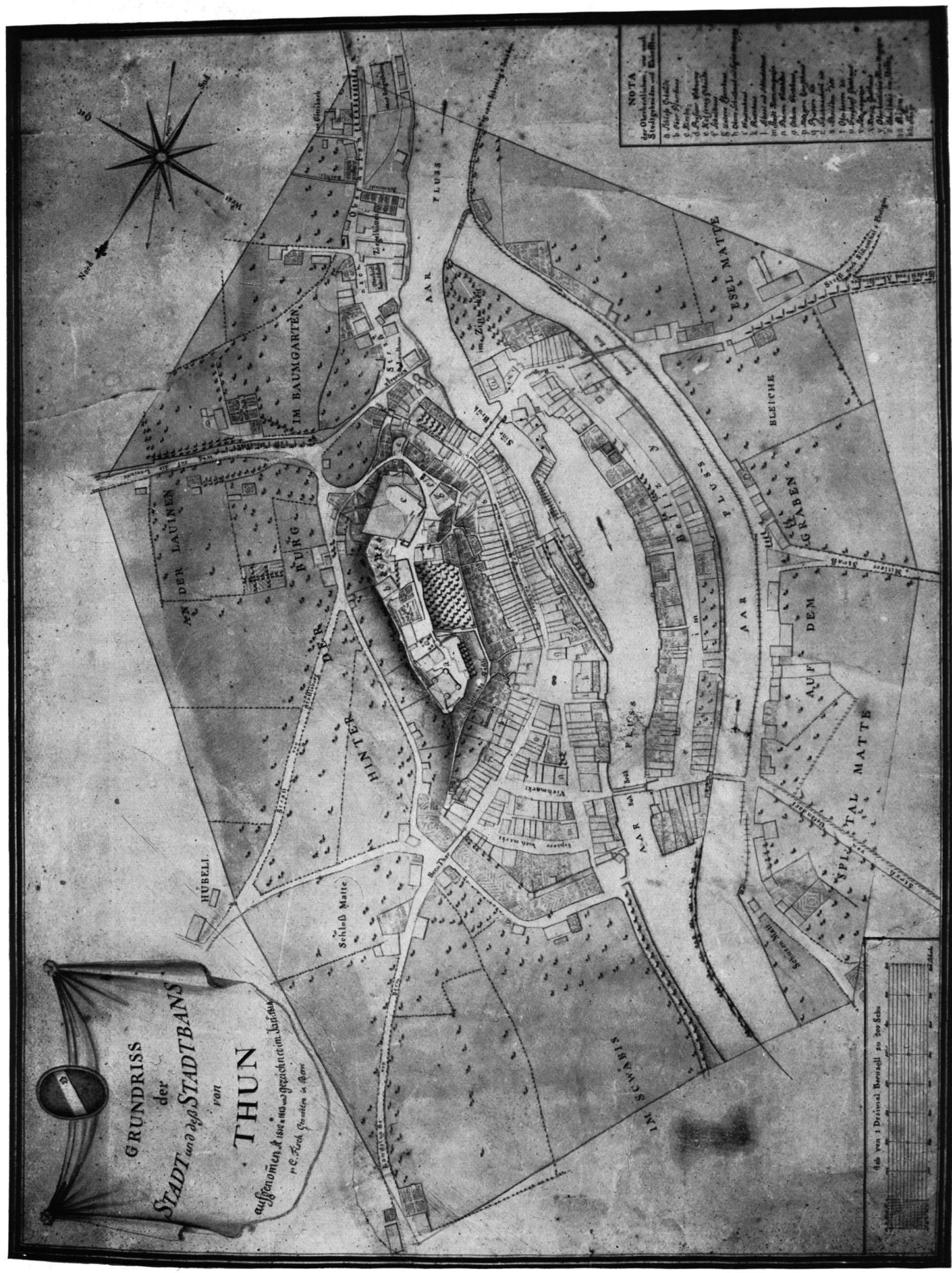
Stadtplan von Thun mit den Grenzen des Burgernziels, aufgenommen und gezeichnet 1814 von Caspar Fisch († 1819).