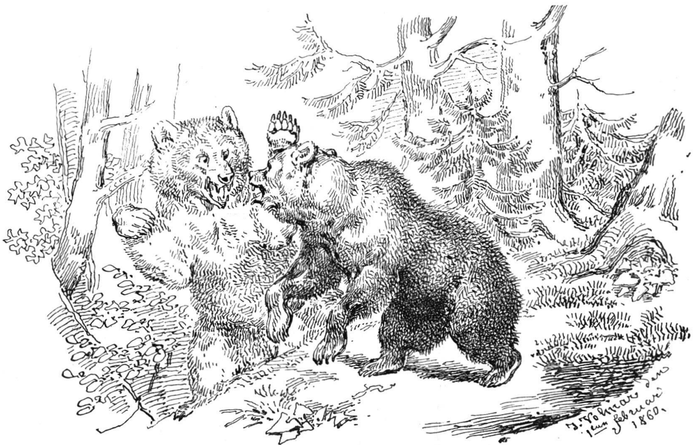
Joseph Volmar (1796 – 1865): Bärenkampf (Federzeichnung).