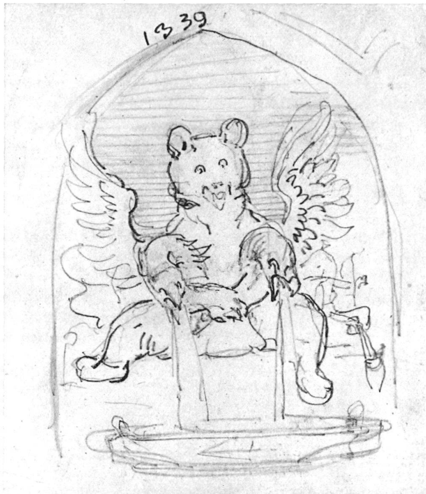
Laupen 1339. Skizze von Joseph Volmar (1796 – 1865), dem Schöpfer des 1849 enthüllten Rudolf v. Erlach-Denkmal.