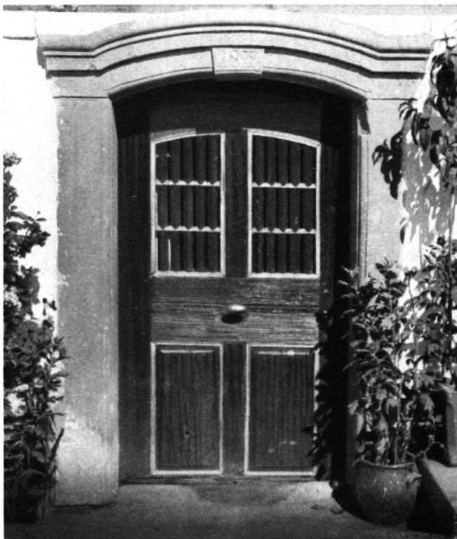
Kellereingang. Auf dem Türsturz aus Sandstein die Jahrzahl 1827. Der Schwarz-Rot-Weiß-Anstrich der Türe ist im Sommer 1939 erneuert worden.