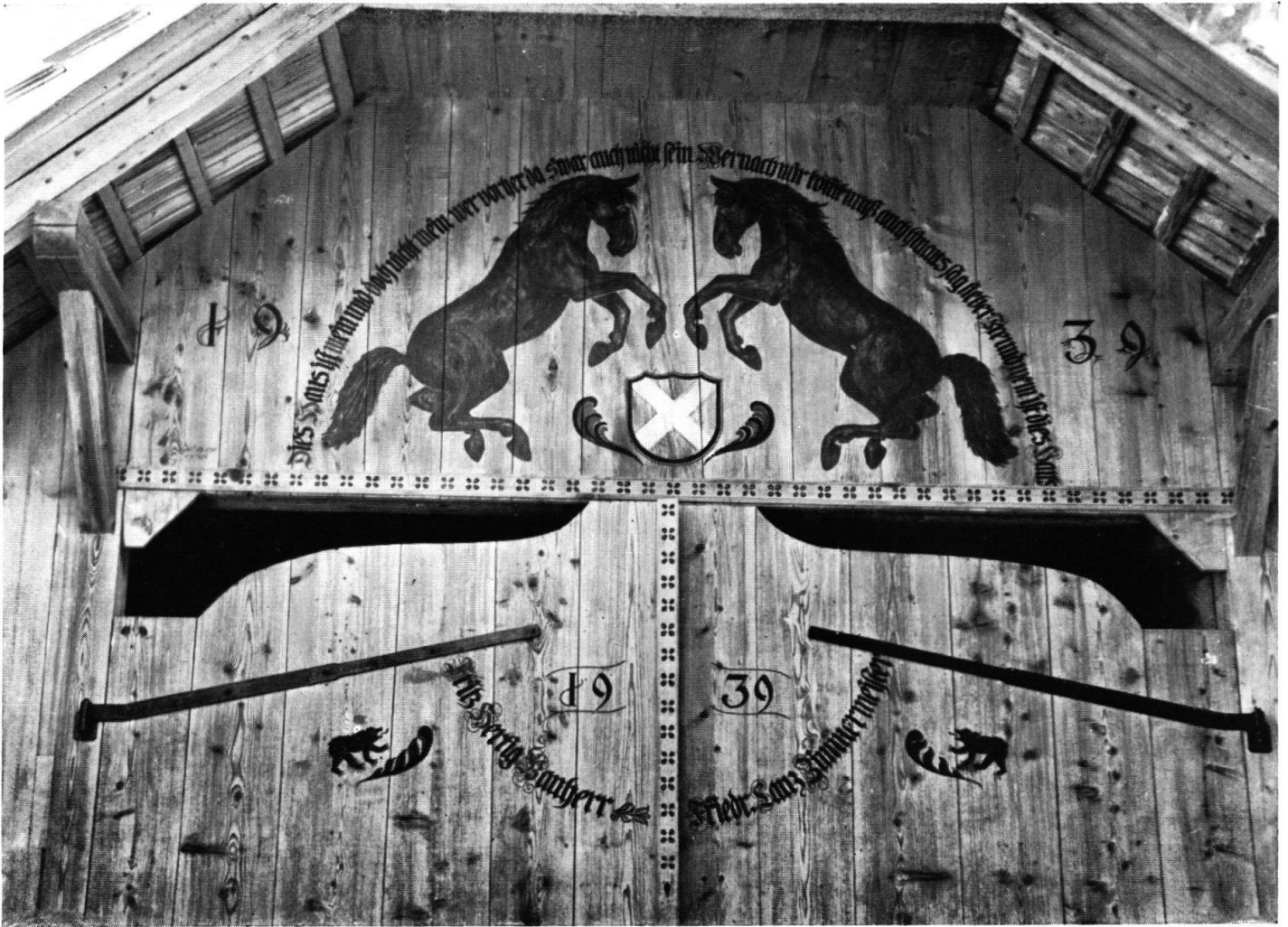
Malerei auf dem Einfahrtstor: „Dies Haus ist mein und doch nicht mein, wer vorher da, 's war auch nicht sein. Wer nach mir kommt, muß auch hinaus, sag', lieber Freund, wem ist dies Haus?“