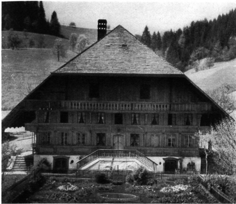
Das Haus vor der Erneuerung des Dachstuhls. Dieser datierte noch aus dem Jahre 1685. Keller, Stuben und Gaden sind in den Jahren 1827—29 neu errichtet worden. Ohne Zweifel ist die Zentrallage der Küche ursprünglich.