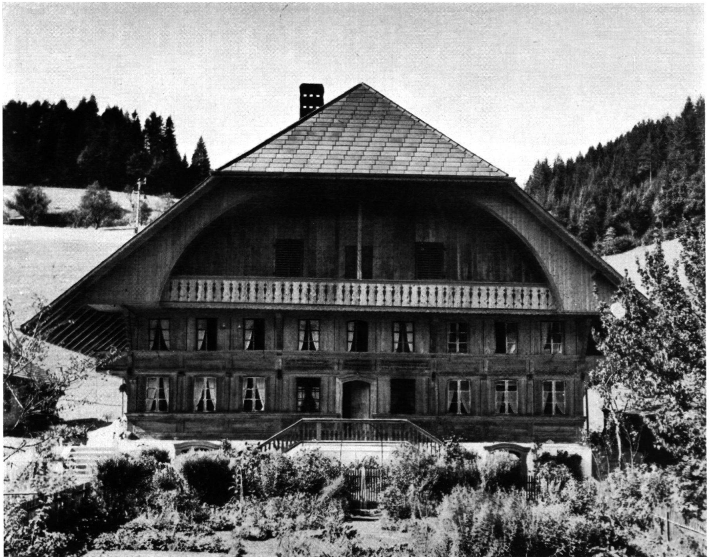
Das Haus, wie es heute steht. Den Umbau besorgte in vorbildlicher Art und Weise Zimmermeister Lanz, Längmatt bei Zollbrück. Man beachte die feingeschwungene Linie der Ründe sowie die einfachen, materialgerechten Laubenausschnitte.