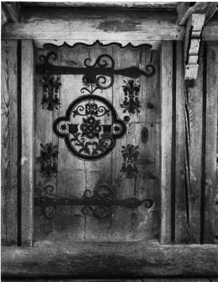
Die Speichertüre des ersten Stockwerkes Die Malereien sind im Sommer 1939 erneuert worden.