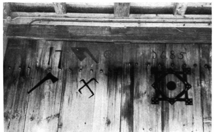
Malereien auf dem östl. Tennstor. 1685.