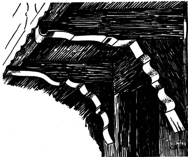
Abb. 6. An den Seiteneingängen des Hauses reichen sich zwei Bauepochen die Hände. Links der Türe stützen die elegant geschnitzte Pfette und die Konsole aus dem Jahre 1829 die Laube. Rechts dagegen wächst wuchtig die Konsole des Jahres 1685 aus der Wand heraus und führt den gleitenden Blick auf die Pfette mit ihrem charakteristischen Abschlußwulst.

Das Wohnhaus datierte damals aus dem Jahre 1685. Heute sind davon lediglich das Dreschtemm und einer der beiden Laubenpfetten mit ihren Konsolen bei den seitlichen Türen zum Hausgang übriggeblieben (s. Abb. 6). Die Tennstore zeigen in Schwarz und Rot Motive damaliger Bauernmalerei, es sind dies früheste Beispiele farbiger Volkskunst im Emmental. Auf dem Tor der Westseite sind hingemalt: Meißel, Hammer, Breitaxt, Beil und zwei gekreuzte Bundhaken neben dem sechsteiligen Zirkelschlag im rot und schwarz aufgeteilten Kreisband, eine aus zwei Quadraten konstruierte Figur, sowie die Jahrzahl 1685, welche erst in jüngerer Zeit vom Traufladen hierher ver-