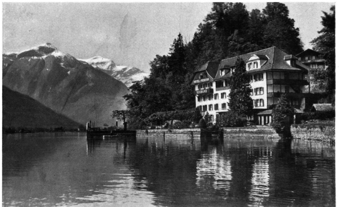
Die heutige Ansicht mit dem an Stelle der alten Mühle errichte- ten Hotelbau.