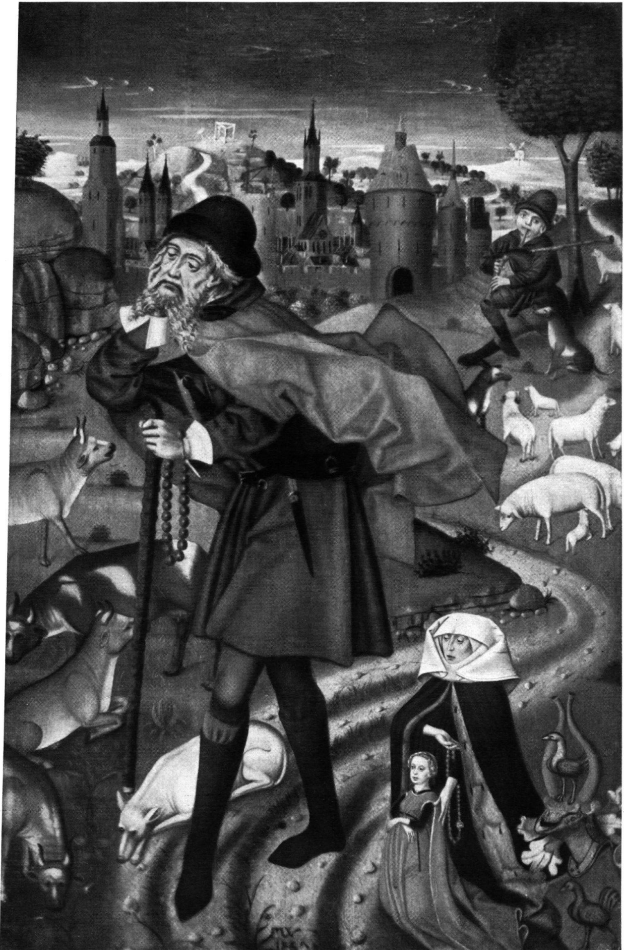
Friedrich Walther. Hl. Wendelin, 1467. Bern, Historisches Museum.