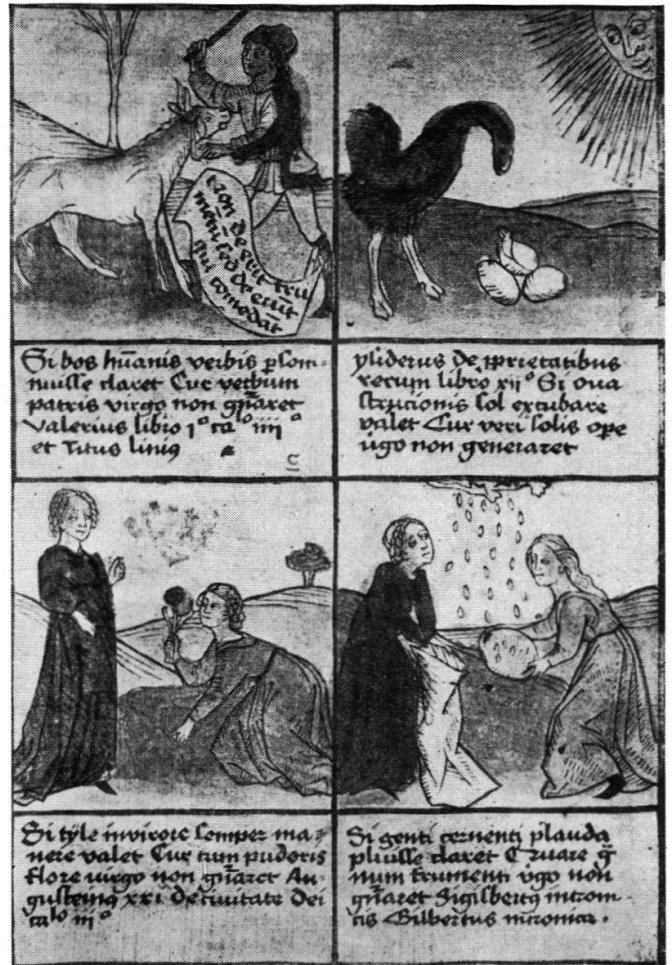
3. Friedrich Walther. Aus dem Defensorium virginitatis Mariae. 1470.