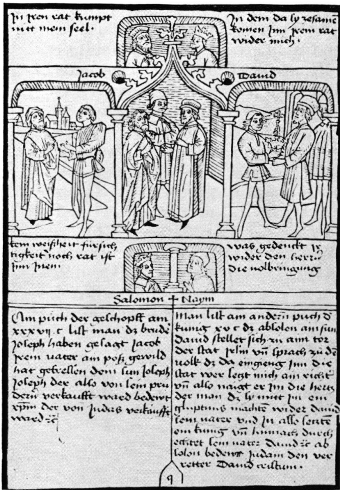
2. Friedrich Walther und Hans Hurning. Aus der Biblia pauperum. 1470.