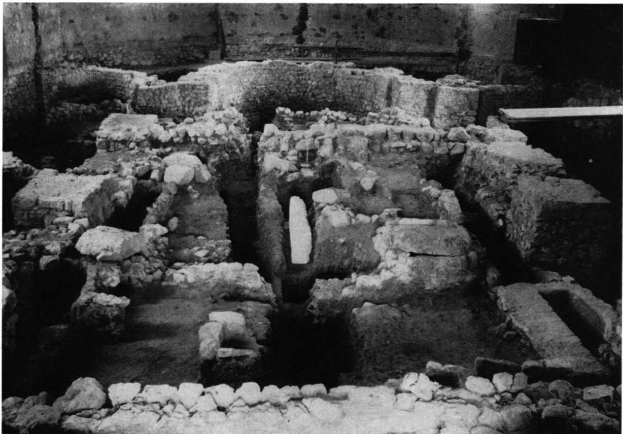
Kirche Oberbipp: Ausgrabung Mai-Juli 1959. Blick auf die Fundamente der romanischen Pfeilerbasilika aus dem 11./12. Jh. und auf Reste älterer Anlagen bis zurück ins 2. Jh.