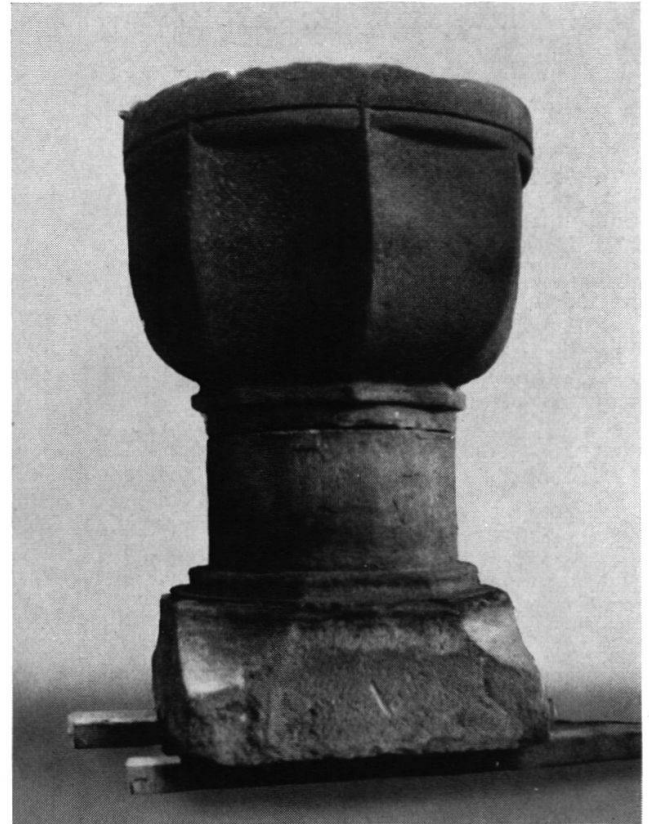
Kirche Neuenegg: Vor der Restaurierung war der Sockel des Taufsteines durch den Fußboden überdeckt. Rechts der vollständige Taufstein.