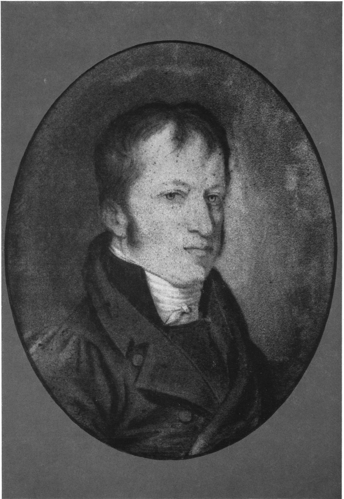
Philipp Emanuel von Fellenberg 1771 — 1844