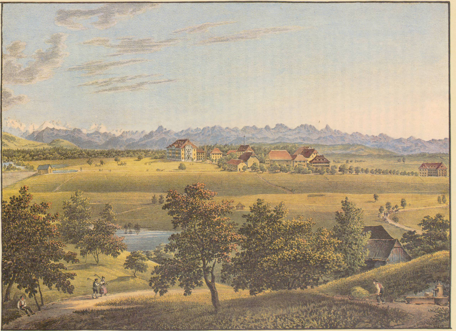
Gesamtansicht von Hofwil (um 1830/40)