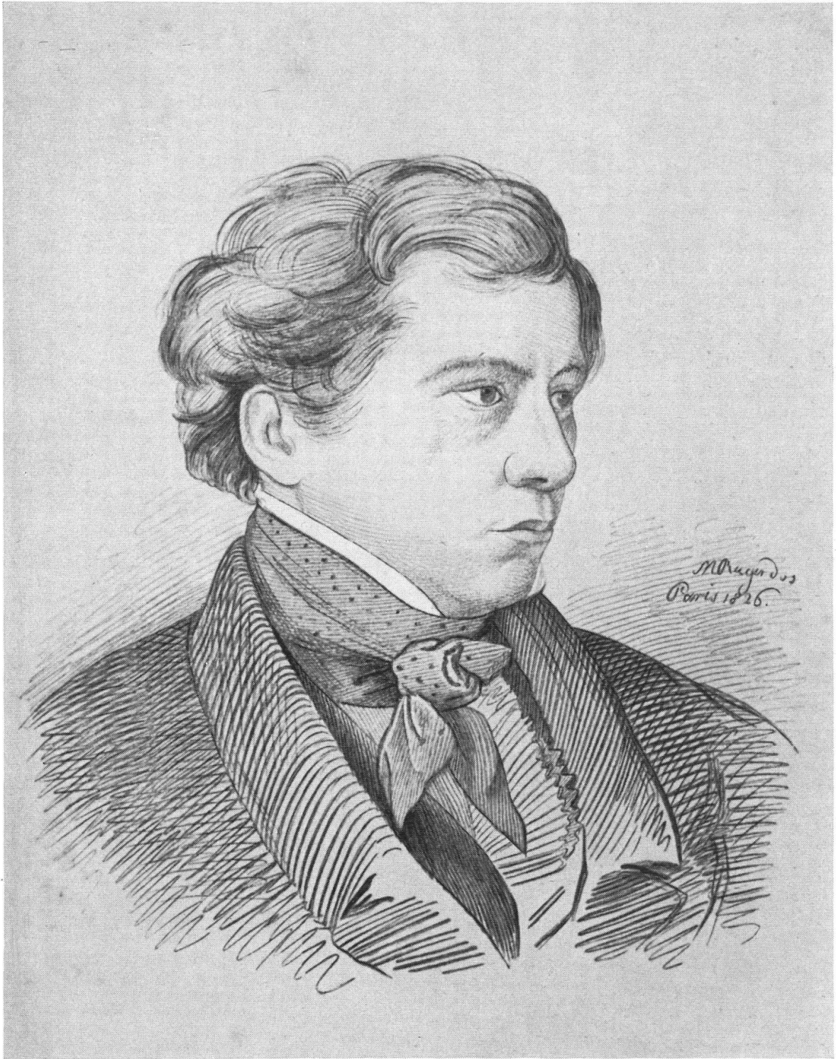
Victor Aimé Huber