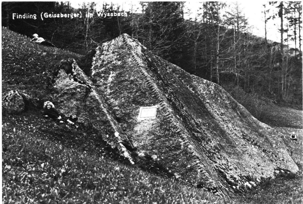
Abbildung 4: Der «Geißberger» im Wyßbachgraben