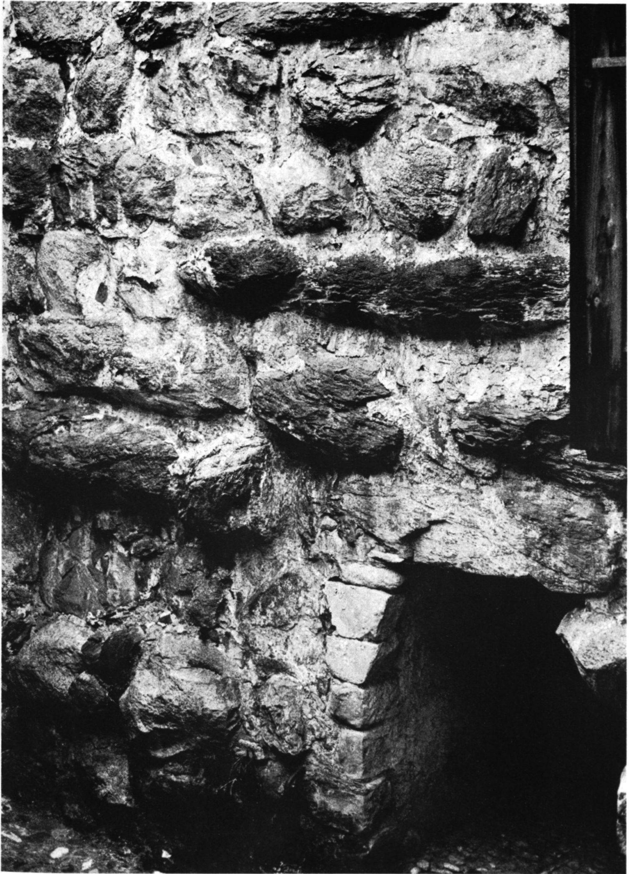
Abbildung 1: Der Schloßwil-Turm (Erläuterungen Seite 21ff.)