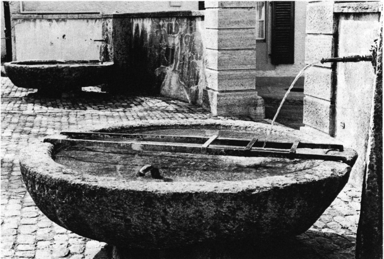
Abbildung 2: Die beiden Brunnen in Schloßwil