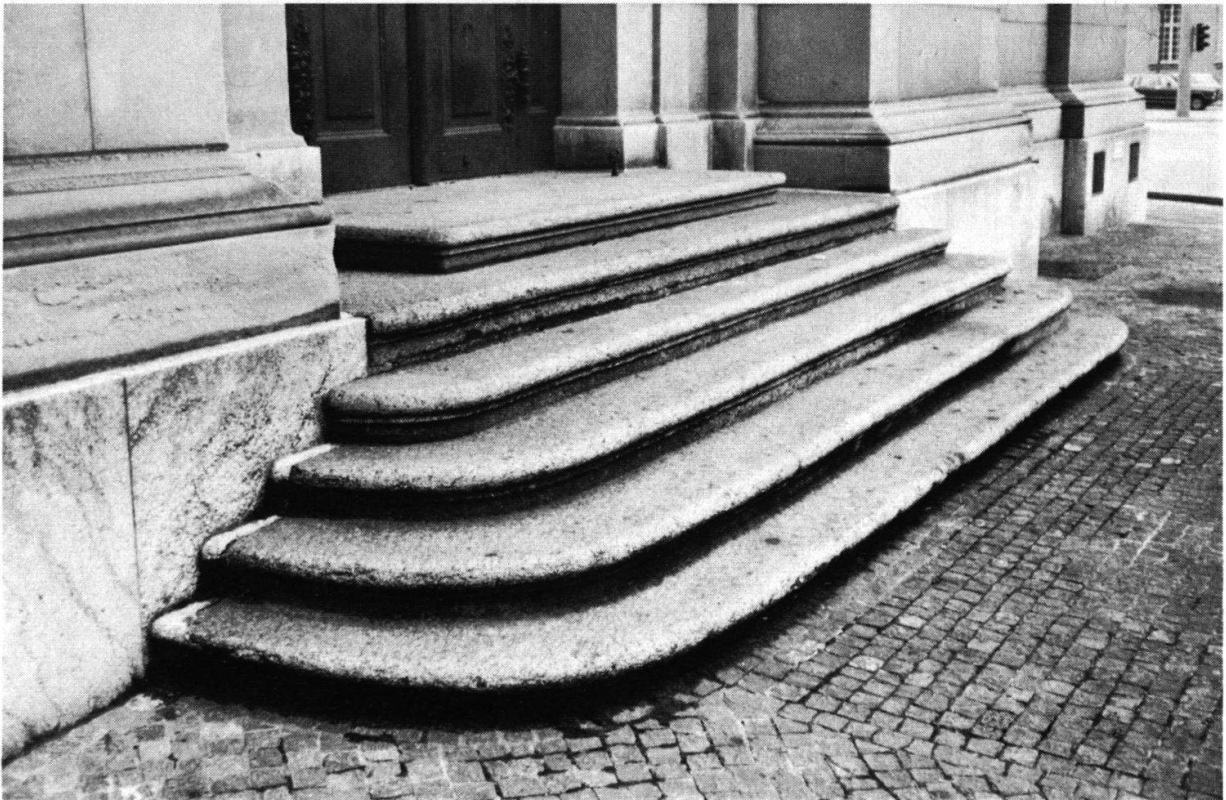
Abbildung 3: Die Treppe auf der Nordseite der Heiliggeistkirche in Bern