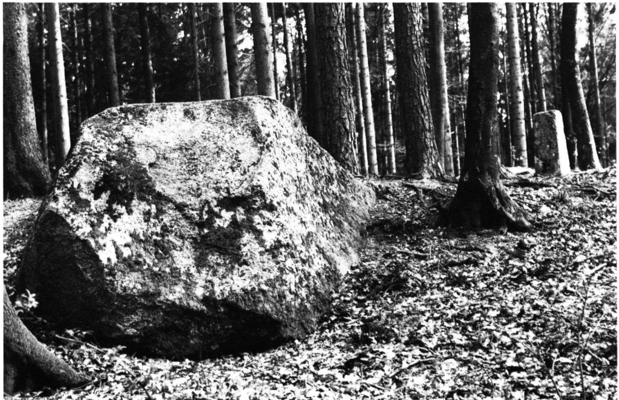
Abbildung 5: Alter und neuer Grenzstein auf dem Büttenberg