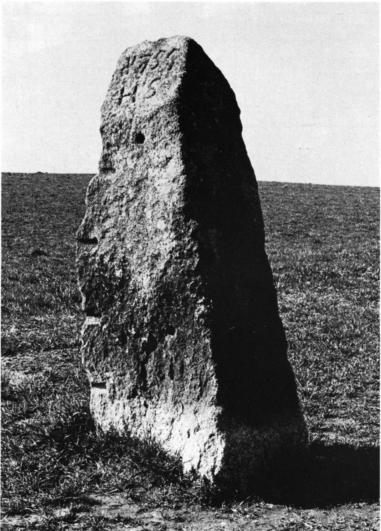
Abbildung 6: Der «Lychleustein» in der Gemeinde Oberthal