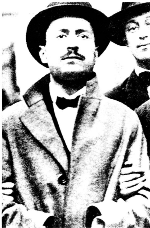
Polizeifoto Mussolinis, aufgenommen am 19. Juni 1903 während seiner Haft im Berner Untersuchungsgefängnis.

Mussolini, der junge Revolutionär: Sein Aufenthalt in der Schweiz beeinflusste entscheidend seine späteren politischen Vorstellungen und Ziele.