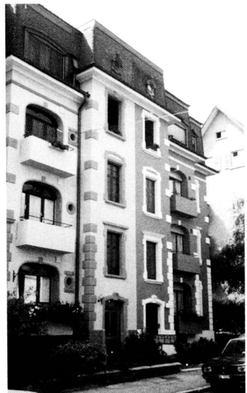
Im heute vollständig renovierten Wohnhaus an der Cäcilienstrasse Nummer 20 logierte Mussolini während seines Berner Aufenthaltes im Jahre 1903.