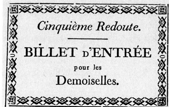
Zwei Eintrittsbillette für den Ball 1808. (Sammlung «Druckbelege Haller». Stadt- und Universitätsbibliothek Bern.)

Deutlich wird in dieser Schilderung, welcher repräsentativen Charakter die Bälle in der Restauration hatten. Sie veranschaulichten die strikte Trennung der Gesellschaftsschichten, wie sie den politischen Vorstellungen der Restauration entsprach. Karl Howald schildert uns in seiner Chronik auch den Ballbetrieb: