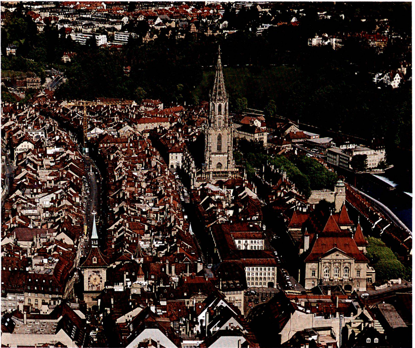
Im Dreieck Münster-Zeitglocken-Casino steht als Zeuge des alten Quartier latin Berns das Gebäude der Stadt- und Universitätsbibliothek und der Bürgerbibliothek.