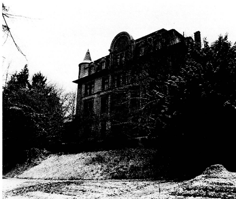
Das alte Kocherspital, Zustand 1987.

Das ALTE KOCHERSPITAL (Schlösslistrasse 11) wurde 1904 als Privatspital auf dem Grundstück des Ilmenhofes realisiert. Als Bauherr zeichnet der berühmte Berner Chirurg und Nobelpreisträger Theodor Kocher; das Spitalgebäude, das weitgehend nach den Plänen Kochers erbaut wurde, ist gattungsgeschichtlich nicht uninteressant, eine eigentliche Schutzwürdigkeit ist jedoch nicht abzuleiten. Durch Schenkung gelangte das Gebäude an die Burgergemeinde, die es in der Folge als Dépendance des Burgerspitals nutzte. In der jüngsten Vergangenheit waren Künstlerateliers in den geräumigen Spitalräumlichkeiten untergebracht. 298 Das alte Kocherspital ist zum Abbruch vorgesehen; an seiner Stelle soll die Wohnüberbauung «Schlösslipark II» entstehen. Der wesentlich ältere Ilmenhof dagegen kann nach einem Vorstoss der Denkmalpflege erhalten und in das Projekt integriert werden; er ist auch aussenräumlich und als Bezug zum benachbarten Frisching-Haus wertvoll. J. K.