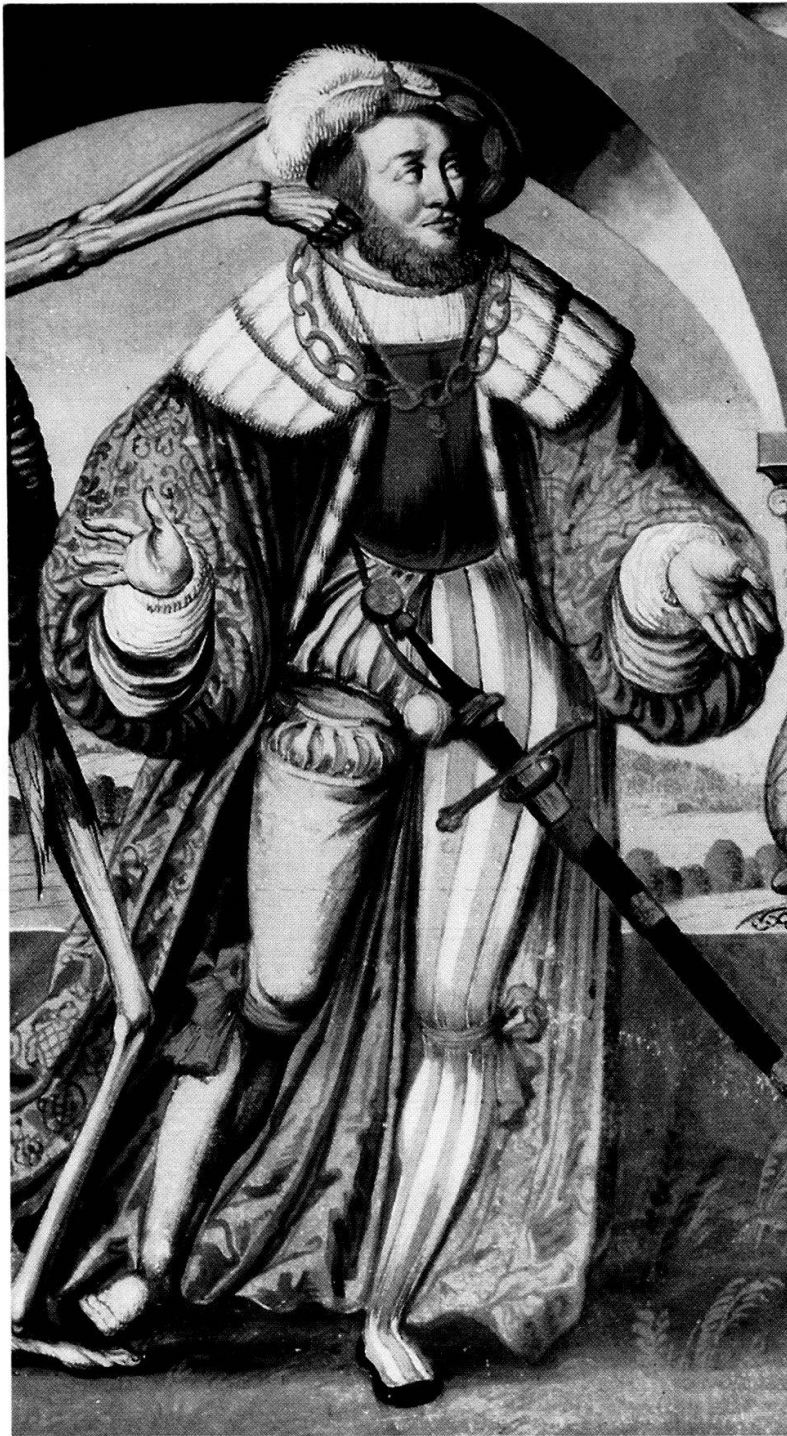
Kaspar von Mülinen als Herzog in Niklaus Manuels Totentanz, Kopie von Albrecht Kauw. Bernisches Historisches Museum, Inv.-Nr. 822.12.

bezieht sich wahrscheinlich auf diese Form, die der Stein auch in seinem Rohzustand aufweist. Der in drei Ecken geschnittene Saphir hatte vermutlich eine Form, die in der Fachsprache als Triangel bezeichnet wird. Der geviert geschnittene Saphir und der geviert gefasste Amethyst 181 könnten mit verschiedenen viereckigen Schliffen bearbeitet gewesen sein. Es kommen aber