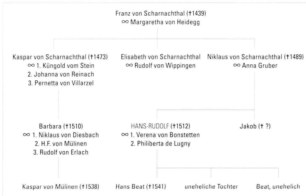
Die Familie von Scharnachthal 201

weise werden beide im Testament weder erwähnt noch bedacht. Uneheliche Kinder haben nach Stadtrecht keinen Anspruch auf einen Erbteil aus dem Familienvermögen. Es stand Eltern und Verwandten frei, sie mit einer «fryen gab» in Form eines testamentarischen Legates abzufinden. In der Regel wurde dies in grosszügigem Masse durchgeführt, wie verschiedene Bestimmungen im vorliegenden Testament zeigen. 90