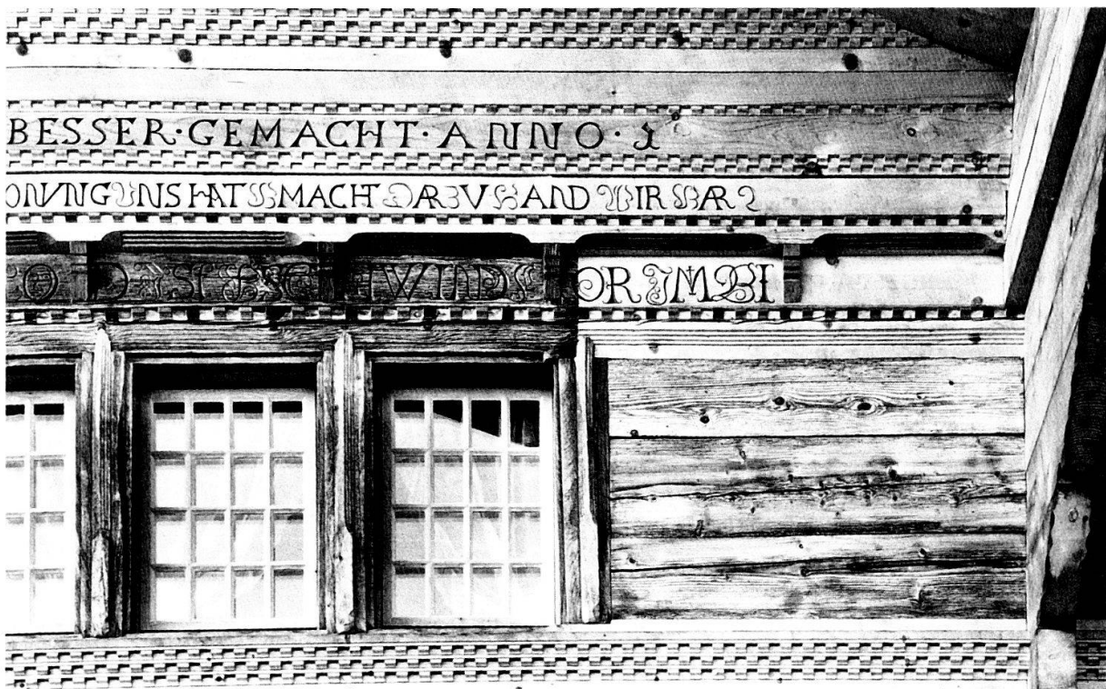
Die Antiquainschrift am 1655 erbauten Bauernhaus «Rüdeli» in Blumenstein (Nr. 216) war durch Fäulnis und Holzkäfer stark zerstört. Noch lesbare Teile wurden auf die ersetzten Balken übertragen, die vollständig verlorenen Zeilenenden blieben unergänzt.

gen einer Farbe; Mikroquerschliffe zeigen, ob eine Farbschicht unmittelbar nach der Erbauung eines Hauses oder erst Jahre später auf bereits verwittertes Holz aufgetragen worden ist und ob Übermalungen vorhanden sind. Bei Übermalungen geben Freilegetreppen (Stratigraphien) Auskunft über die Aufeinanderfolge und Anzahl der Farbschichten. Ziel dieser Methoden ist es, eine möglichst fehlerfreie Interpretation der noch vorhandenen Spuren zu erreichen, welche bei der vorher praktizierten, rein optischen Beurteilung der Spuren nicht gewährleistet ist, da sich zum Beispiel Zinnober als nicht lichtechtes Pigment an der Oberfläche schwarz oder Bleimennige unter dem Einfluss von schwefliger Säure weiss verfärben können. All diese neuen Anforderungen verdeutlichen, warum das Restaurieren eine spezifische Ausbildung bedingt und warum nach 1978 nicht mehr die Stelleninhaber selbst diese Arbeiten ausführen, sondern externe Restaurator/-innen beauftragt werden. Am augenfälligsten ist die Entwicklung in der Restaurierung bäuerlicher Malereien wohl daran zu erkennen, dass zum Beispiel in den 60er Jahren für die Renovierung einer Oberländer Hausfassade mit Laien eine Woche genügte, während heute die Restaurator/-innen mehrere Wochen, bei umfangreicheren Malereien und Inschriften sogar Monate aufwenden müssen. Der erhöhte zeitliche Aufwand ist einerseits auf die oben beschriebenen Voruntersuchungen und Dokumentationsarbeiten zurückzuführen, und