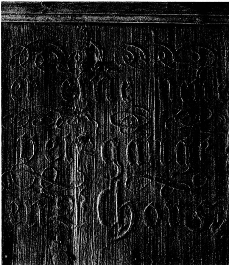
Selbst im schwachen Tages-Streiflicht ist das gut erhaltene Relief der abgewitterten Frakturinschrift am Mitte 18. Jh. erbauten Speicher in Schnenzenbach (Gemeinde Ochlenberg, Nr. 80 B) deutlich erkennbar.

der dadurch ermöglichten Finanzierung solcher «Luxusarbeiten» und der Stadt und Land verbindende Aspekt hervorgehoben werden. «Die Töchter hatten ihre Geigen, Blockflöten und andere Instrumente mitgebracht – allabendlich wurde konzertiert und gesungen, so dass die Bauersleute die «Stadtmeitschen» nur höchst ungern scheiden sahen. Ganz unmerklich ergab sich eine herzliche Beziehung zwischen den so verschieden gearteten Menschen. Wir aber meinen, dergestalt sei die originelle Heimatschutz-Aufgabe nicht allein praktischer Art, sondern eine eigentliche Herzensangelegenheit geworden. Ist das nicht höchst erfreulich?». 12 Auch auf das spektakuläre Ableuchten von Ornamenten und Inschriften wird hingewiesen, das den Hausbesitzern wie durch Magie die für sie vorher unlesbaren Sprüche wieder hervorzaubert. «Da wurden erst in dunkler Nacht unter dem schräg auffallenden Licht der Taschenlampen die kaum mehr sichtbaren Schriftzeichen und Verzierungen festgelegt». 13 Das «Ableuchten» ist die auch heute noch praktizierte, bisher einzige Methode, um verwitterte Ornamente und Inschriften – zumindest ihrer Form nach – wieder zu finden. Das Holz ist durch die Malereien vor der Verwitterung geschützt und bleibt auch dann, wenn die Farbe weggewittert ist, gegenüber den unbemalten Holzpartien erhaben. Dieses Relief kann in der Dunkelheit mittels Streiflicht erkennbar gemacht werden.