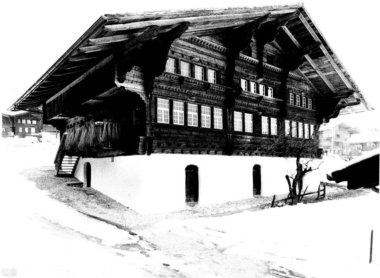
Erlenbach i. S., Museum der alten Landschaft Niedersimmental (Agensteinhaus); Nr. 321, erbaut um 1766, renoviert 1984/85.