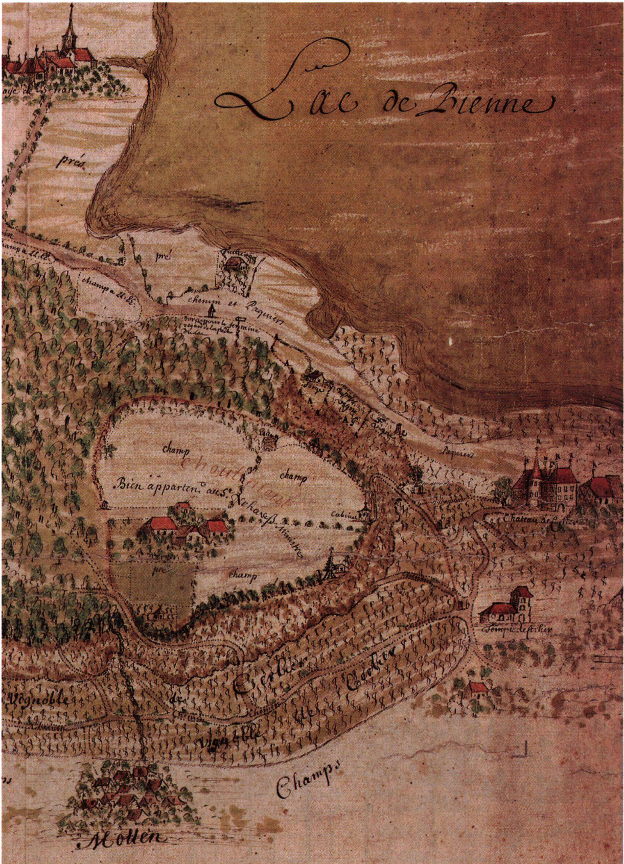
Waldplan im Raum Jolimont von L'Epee, 1711 (Ausschnitt). Noch sind keine forstwirtschaftlichen Details erkennbar (AA IX Erlach 3).