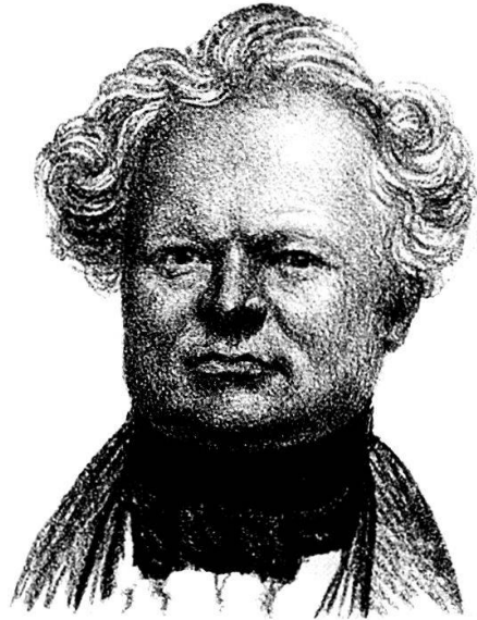
Der Politiker und Historiker Anton von Tillier (1792–1854).

Anton von Tillier gehörte zu den liberalen Patriziern, die die Verfassungsreformen begrüßten. Er hatte bereits in der Restaurationszeit dem Grossen Rat angehört, wurde 1831 wiedergewählt und zum Regierungsrat ernannt. Mehrmals vertrat er den Kanton Bern an der Tagsatzung. Als Politiker zeigte von Tillier wenig Profil. Berühmtheit erlangte er hingegen für seine historische Arbeit. Mit der vierbändigen «Geschichte der Eidgenossenschaft während der Zeit des so geheissenen Fortschritts» schrieb er eine Chronik der Regeneration, die stark von seinen eigenen Erfahrungen geleitet ist und viele persönlich gefärbte Urteile über Zeitgenossen enthält. Seinen Regierungskollegen Neuhaus charakterisierte er als «hochherzig und edelmüthig», attestierte ihm rhetorische Begabung und Wahrheitsliebe, bemängelte aber, dass «ihn sein rasches Blut und sein sehr reizbares Selbstgefühl oft schroff und leidenschaftlich erscheinen» liess (Band 2, 1854, S. 90).