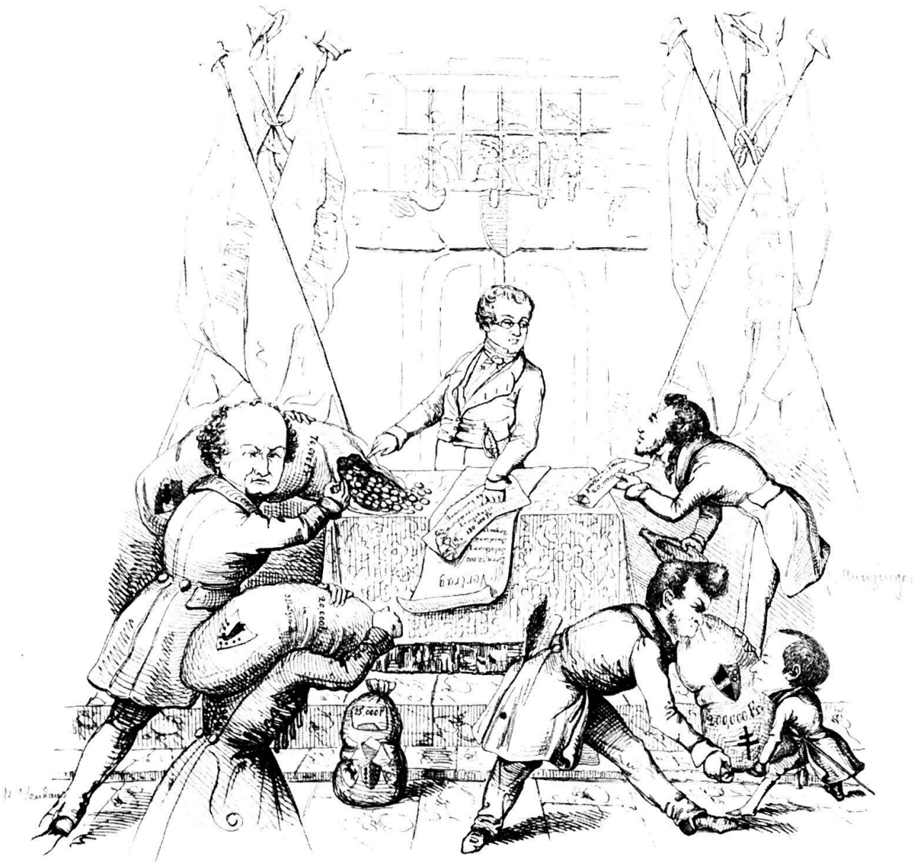
«Die am ersten Aprill in der Schlacht vor Luzern gefallenen 500000». Karikatur von 1845 zum Freikauf der gefangenen Freischärler durch die Regierungen der Kantone Aargau, Baselland, Bern und Solothurn.

Die konservative Luzerner Regierung verlangte von den Kantonen, deren Bürger an den Freischarenzügen teilgenommen hatten, die horrende Summe von 500 000 Franken für die Befreiung der gefangenen Freischärler. Die Forderung konnte später auf 350 000 Franken reduziert werden. Die abgebildeten Kantonsvertreter übergeben einem Mitglied der Luzerner Behörden ihren Lösegeldanteil. Auf der linken Seite des Bildes ist der Berner Regierungspräsident Charles Neuhaus erkennbar, auf der rechten Seite vorne ist der aargauische Regierungsrat Augustin Keller abgebildet, hinter ihm steht Josef Munzinger als Vertreter der Solothurner Regierung.