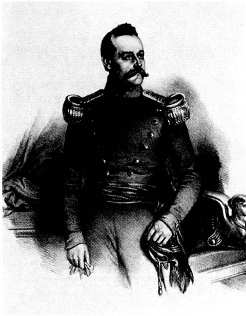
Ulrich Ochsenbein (1811–1890).

Ochsenbein stammte wie Jakob Stämpfli aus bäuerlichen Verhältnissen. Er hatte Rechtswissenschaft studiert und führte seit 1834 eine Anwaltspraxis in Nidau. Grosse Popularität gewann er mit der militärischen Führung des zweiten Freischarenzuges. Seither trat er im Berner Grossen Rat an der Seite der Radikalen als heftiger Kritiker der Regierung Neuhaus auf. 1846 in den Regierungsrat gewählt, war er bereits 1847 Regierungspräsident und zugleich Präsident der Tagsatzung. Nach einem glänzenden Resultat in den Nationalratswahlen von 1848 wurde Ochsenbein zum ersten Nationalratspräsidenten ernannt und bald darauf in den Bundesrat gewählt, wo er die Leitung des Militärdepartementes übernahm. In den folgenden Jahren verlor er seine frühere Popularität. Er war vom Freisinn abgerückt und sympathisierte mit den seit 1850 im Kanton Bern regierenden Konservativen. 1854 entzog ihm die Bundesversammlung das Vertrauen und wählte an seine Stelle Jakob Stämpfli in den Bundesrat.