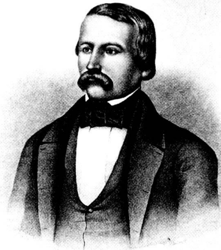
Jakob Stämpfli (1820–1879).

Jakob Stämpfli hatte sich mit unerschöpflicher Energie vom einfachen Bauernsohn zum Anwalt emporgearbeitet. Als begeisterter Anhänger von Wilhelm Snell engagierte er sich schon während des Studiums in der Politik. Er gründete Ende 1844 die freisinnige Berner Zeitung und versammelte nach dem Debakel des zweiten Freischarenzuges die Radikalen im bernischen Volksverein. Schon 1845 propagierte Stämpfli die Revision der Berner Verfassung. Er strebte die Demokratisierung des politischen Systems und Reformen im Bereich der Wirtschafts- und Sozialpolitik an. 1846–1850 war er Mitglied der radikalen Berner Regierung. Seit 1848 sass er zudem im Nationalrat. Seine steile Karriere gipfelte 1854 in der Wahl zum Bundesrat. Als Parlamentarier und Bundesrat stellte er sich gegen die mächtigen Wirtschaftsliberalen aus Bank- und Eisenbahnkreisen. 1863 zog er sich zur grossen Überraschung der Öffentlichkeit von seinen politischen Ämtern zurück.