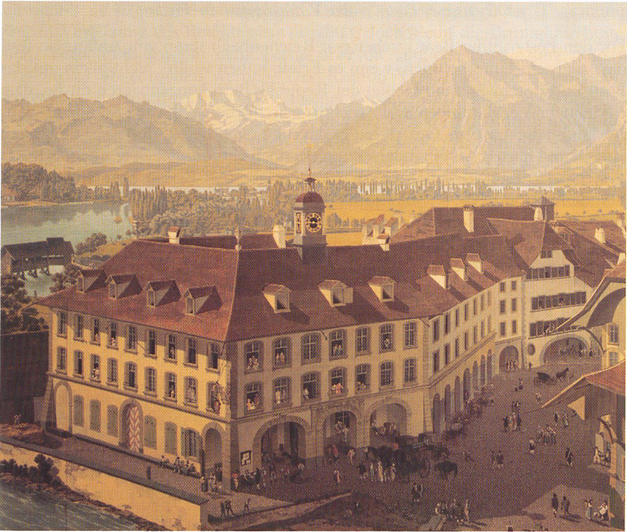
Die Postkutsche der Fischerpost (Thunpost) vor dem Freienhof in Thun, um 1810. Ausschnitt aus dem Panorama der Stadt Thun von Marquard Wocher (1760–1830), Besitz der Eidg. Gottfried Keller-Stiftung, Verwaltung: Kunstmuseum Thun.

Belmont dagegen hat als Maximum 1'600 Franken Jahresgehalt bezogen. Bei guter Leistung wird jährlich auch eine Gratifikation ausgeschüttet. Der Sekretär der Postdirektion, der aus dem Kreis der Anteilhaber gewählt wird, bezieht 800 Franken Entschädigung pro Jahr, zudem ist er mit mindestens 2 Prozent am Gewinn beteiligt, falls dieser 40'000 Franken pro Jahr übersteigt; falls mehr als 60'000 Franken Reingewinn erwirtschaftet werden, beträgt die Gewinnbeteiligung 4 Prozent. Im besten Fall erhält er also zusätzlich 2'400 Franken pro Jahr, im schlechteren verdoppelt sich sein Gehalt wenigstens. 162 Die Gehälter für die Walliser Postbüros, welche von den bernischen Postpächtern betrieben werden, betragen für Brig 500 Franken, für Visp 100 Franken, für Leuk 320 Franken und für St-Maurice, das an der Simplonstrasse ein sehr reges Postgeschäft zu verzeichnen hat, 600 Franken. 163