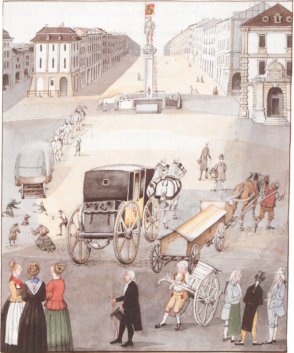
Eine Postkutsche der Fischerpost (Thunpost) am Stalden in Bern. Aus Gerhard Howalds Stadtbrunnenchronik (BBB: Mss.h.h. XXIb. 365, p. 179).