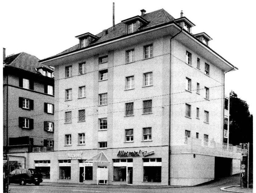
Moserstrasse 42: Neubau.