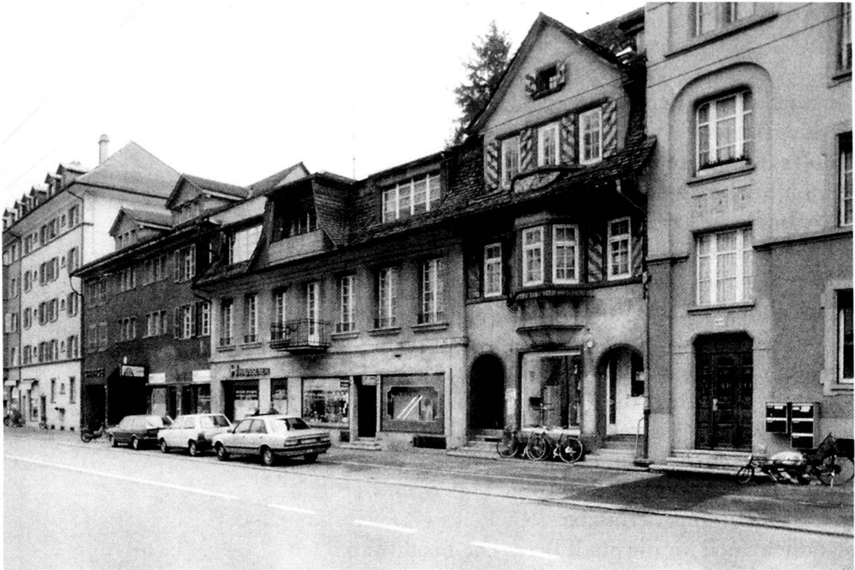
Die Fassaden der 1993 abgebrochenen Häuser Neubrückstrasse 53, 65 und 67.

Die Wohnhäuser NEUBRÜCKSTRASSE 53, 63, 65 UND 67 waren als Restbestände einer ursprünglich offenen Bauweise, wie sie an dieser Ausfallstrasse noch bis ins 19. Jh. üblich war, deutlich gekennzeichnet. Den Charakter des vorstädtisch geprägten Wohnquartiers mit geschlossenen hohen Strassenfluchten erhielt der Strassenzug in der Zwischenkriegszeit. Den historisch bedeutenden Kern des Komplexes bildeten ein ehemaliger freistehender Herrenstock (Nr. 65) und ein ihm rückwärtig zugeordneter, kleiner, steinerner Wohnstock (Nr. 63). Diese Bauten an der einzigen und damit entsprechend wichtigen Strasse nach Norden wurden in den Jahren 1921/22 im Innern durch den damaligen Eigentümer, der auch als Architekt zeichnete, tiefgreifend umgebaut. 1929 wurde das Projekt einer Neuüberbauung an der Ecke Mittelstrasse/Neubrückstrasse abgelehnt, später das Haus Neubrückstrasse 53 in bescheidenerem Rahmen ausgeführt. Gleichzeitig wurde die Strassenfassade des ehemaligen Landhauses in ihrem Aussehen nachhaltig verändert. Das Einfamilienhaus Neubrückstrasse 67 wurde 1912 im zeittypischen Jugendstil von Architekt