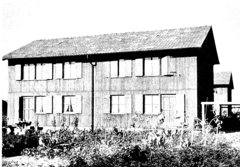
Wangenstrasse 111–117: Die Häuser der «Genossenschaft für bernische Export- und Siedlungshäuser» kurz nach ihrer Fertigstellung.

Während und nach dem Zweiten Weltkrieg herrschte in der Schweiz eine ausgeprägte Wohnungsnot. Zu deren Linderung und gleichzeitig zur Vorbereitung einer potentiellen Export-Offensive in kriegsversehrte Länder wurden verschiedene Holzbausysteme im Sinne einer Vorfabrikation entwickelt. Eines der interessantesten und fortschrittlichsten dieser Systeme war das weitgehend im Werk vorgefertigte Ständer- und Tafelbausystem der «Genossenschaft für bernische Export- und Siedlungshäuser», das sogar an der internationalen Ausstellung für Städtebau und Wohnungswesen in Paris ausgestellt wurde. Die Einwohnergemeinde Bern