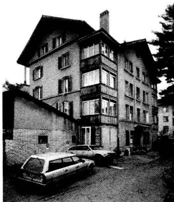
Das Haus Ulmenweg 9 vor dem Abbruch.

Das Mehrfamilienhaus ULMENWEG 9 wurde 1863 vom Baugeschäft Dähler und Schultz erbaut. Es war Teil der lockeren Erstbebauung des vorderen Lorrainequartiers. Unter den umliegenden zwei- bis dreigeschossigen, einfachen Ständerbauten fiel das Gebäude durch seine massive Bauweise aus Sandsteinquadern und seine respektable Höhe von vier Vollgeschossen und einem ausgebauten Dachgeschoss auf. In den Hauptbaukörper über längsrechteckigem Grundriss und unter einfachem Satteldach war strassenseitig ein breiter Mittelrisalit mit einem unter der Traufe des Hauptdaches ansetzenden Quergiebel eingefügt; dieser Risalit enthielt das Treppenhaus und sämtliche Nebenräume. Die Winkel zwischen diesem relativ weit vorspringenden Gebäudeteil und dem Hauptbaukörper waren durch ursprünglich vermutlich offene, später verglaste Laubentürme über vier Vollgeschosse unter vorspringenden Flachdächern belegt. Die Details, Fenstereinfassungen und Bankgesimse, wiesen spätklassizistische