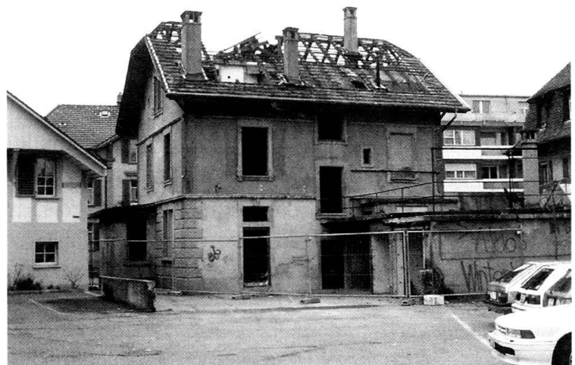
Brünnenstrasse 124 und Bümplizstrasse 117 kurz vor dem Abbruch, bereits «unbewohnbar» gemacht.