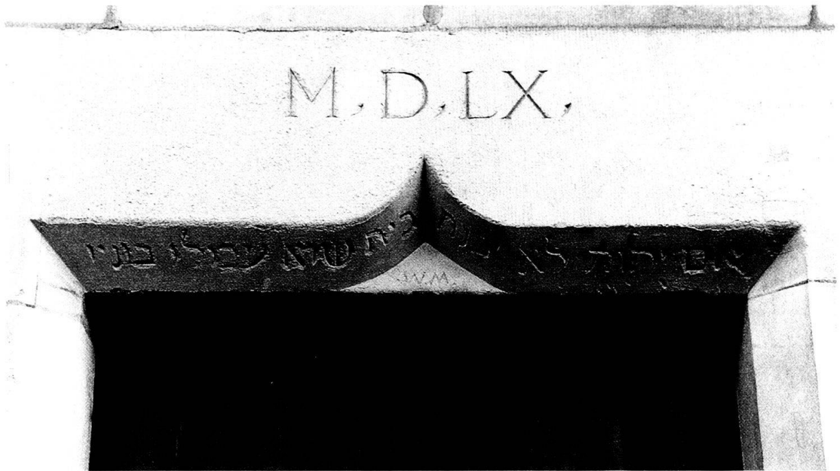
Portal des Berner Hauses von Wolfgang Musculus mit Baujahr 1560, den Initialen «W.M.» und der hebräischen Inschrift «Wo der HERR nicht das Haus bawet / So arbeiten vmb sonst / die dran bawen.» (Psalm 127,1 in der Übersetzung von Martin Luther).

Augsburgs vor der Predigt von der ganzen Gemeinde Davidpsalmen mit hervorragenden Melodien gesungen würden, so, dass es eine wahre Freude und eine Quelle geistlichen Trostes sei. Nach der Predigt, die dem Grundsatz der lectio continua folgte, werde noch ein weiterer Psalm angestimmt. 36 Das Jahr 1531 stimmt merkwürdig mit Musculus' Angabe zusammen, er habe an seinem Kommentar zwanzig Jahre lang gearbeitet. Zum Erbauungscharakter des Psalmen-gesangs gesteht er, zur Zeit des «geharnischten Reichstages» von 1547/48 sei er von nichts so wohltuend bewegt, so sehr gestärkt und manchmal bis zu Tränen gerührt worden wie von diesem einmütigen und einstimmigen Gotteslob der Gemeinde. 37