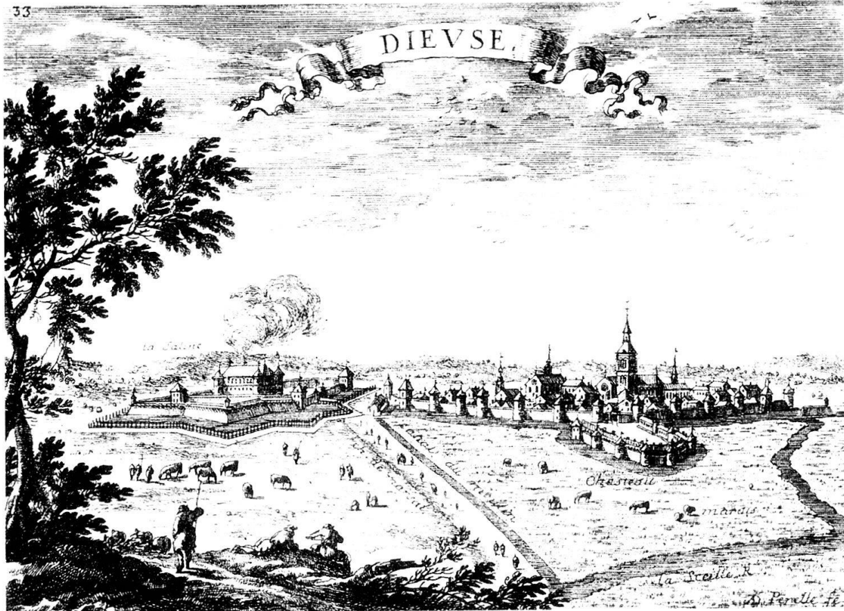
Ansicht der Stadt und Saline Dieuze. Kupferstich von 1694, bezeichnet mit «A.D. Perelle fe.» (München, Bayerische Staatsbibliothek).

zum Prediger für Dorlisheim. 10 1528 wurde er an der Seite von Matthäus Zell (1477–1548) Diakon am Münster. Er besuchte Bucers und Capitos Vorlesungen, war Bucers Sekretär und lernte Hebräisch. In dieser Situation erreichte ihn der Ruf aus Augsburg.