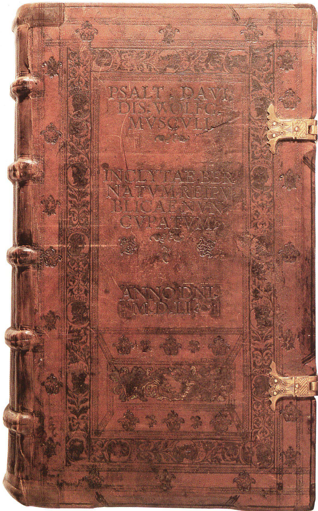
Psalmenkommentar von Wolfgang Musculus in einem Prachtband für den Berner Rat (StUB, C.25).