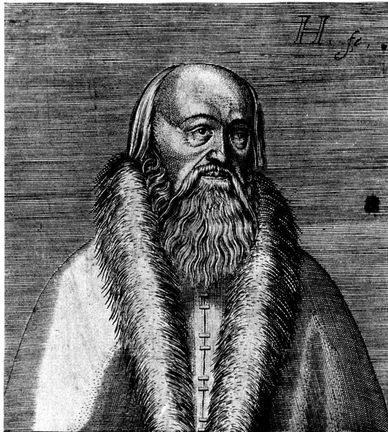
Porträt des alten Musculus. Kupferstich aus: Hendrick Hondius d.Ä.: Icones virorum ... illustrium, Den Haag, um 1599 (Augsburg, Staats- und Stadtbibliothek).

WOLFGANGES MUSCVLES. Talis erat vultu Wolfganges muscules olim, Ipsa a quo metuit Roma prophana sibi. Illius ut rapidos unguis, catos que rapaces, Non metuit: contra sic metuendus erat.