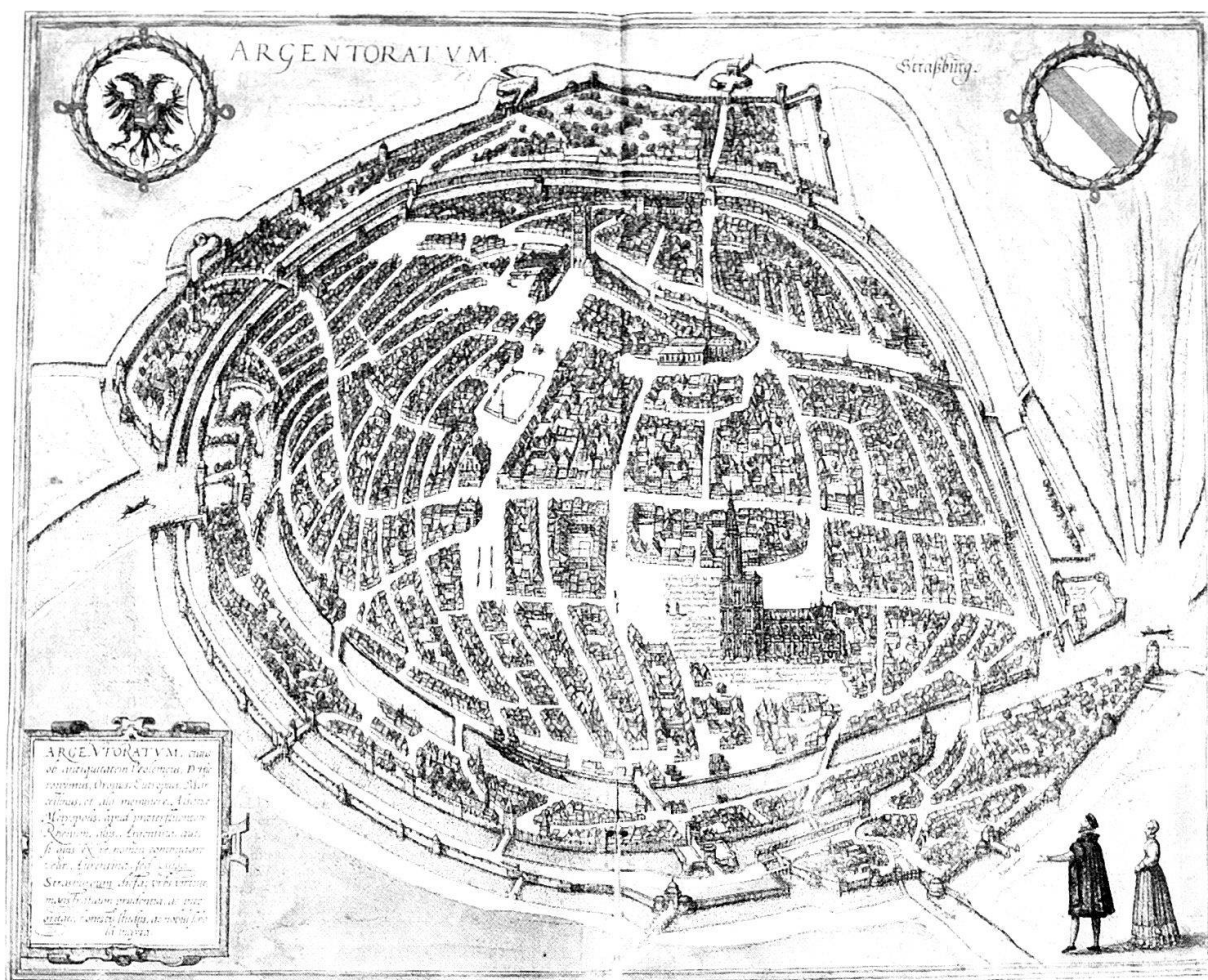
Stadtansicht von Strassburg. Kolorierter Druck aus: Georg Braun, Franz Hogenberg: Civitates orbis terrarum, Band I, Köln, nach 1588.