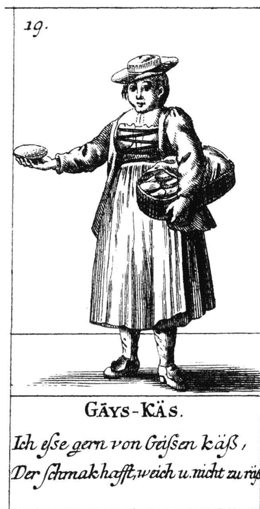
Abb. 7 Zwei Figuren des Kupferstechers David Herrliberger von 1748/49. Links ein Verkäufer von Schreibtafeln und Schwyzertee, der ausruft: «Mich bringen über Land und See, Schreib-Tafeln samt dem Schweizer Thee.» Rechts eine Geisskäse-Verkäuferin, die ihre Ware anpreist: «Ich esse gern von Geissen Käß, der schmackhaft, weich und nicht zu räp.»

usw. gesammelt, hernach ze öfftern, bis auf 7 mal abgesotten und geläutert. Meist auf Thun geliefert und von da in die benachbarten Apotheken nach Lucern, Freyburg, Basel, Solothurn und nach Deütschland versandt. Die jährliche Exportation mag kommen auf 20 Centner à L 120