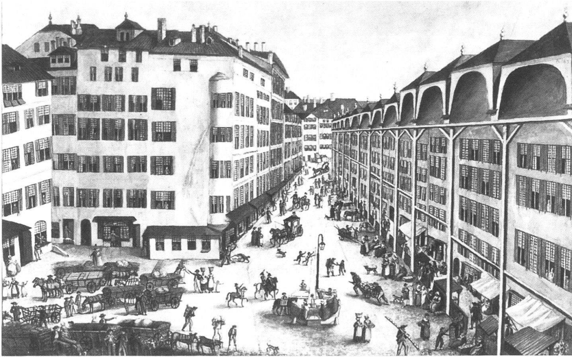
Abb. 3 Holzmarkt auf der Place St-Gervais in Genf um 1800, Gouache von Christian Gottlob Geissler. Die Stadt Genf hatte für die waadtländische Holzproduktion sowohl als Verbraucherin wie als Exportplatz nach Frankreich eine besonders grosse Bedeutung.

nach England exportierten. Ein wichtiger Teil dieser Tätigkeit ist also von der bernischen Obrigkeit ignoriert worden, sofern sich nicht der Export dieses Produkts zwischen dem Ende des Jahres 1785 und den frühen 1790er Jahren schlagartig erhöht hat.