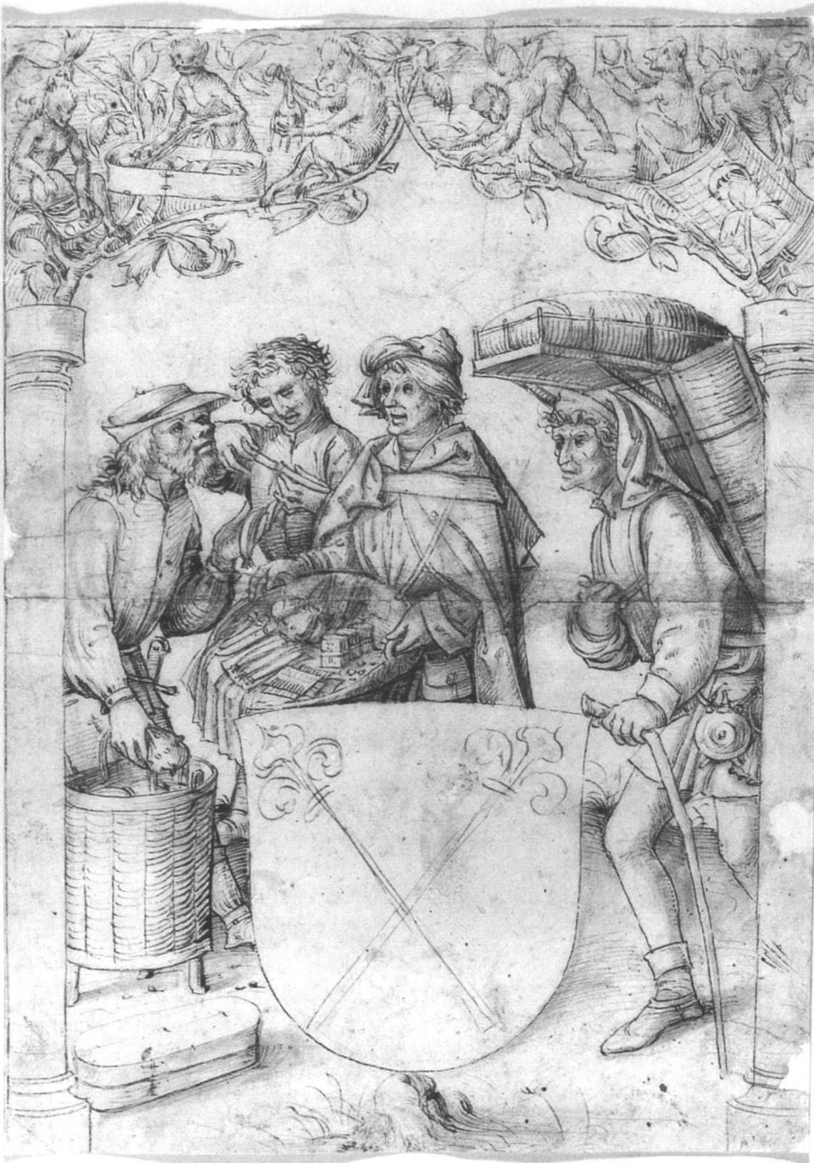
Abb. 1 Dieser Scheibenriss mit Krämern und einem Zunftwappen wurde zwischen 1490 und 1500 von einem unbekanntem Berner Meister geschaffen. Die Händler transportieren ihre Waren mit Tragräb, Korb und einer Spanschachtel, die zugleich als Bauchlade dient. Der Mann in der Mitte präsentiert unterschiedliche Kleinwaren wie Messer, Spielkarten und Gewürze. Links davon prüft ein Kunde die Schärfe eines Messers, und der Korbträger greift bereits zum Geldbeutel.