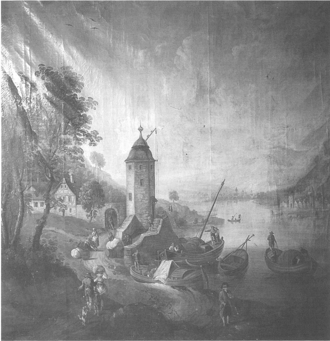
Abb. 2 Idealisierende Darstellung des Handels im 18. Jahrhundert. Ölgemälde im Salon eines Privathauses in Le Locle. Mittels fester und schwimmender Hebekräne werden diverse Handelsgüter in Fässern und Ballen zwischen Land- und Seeverkehr umgeladen. In ähnlicher Weise könnte sich auch der Handelsverkehr in den Häfen am Genfersee abgepielt haben, die für den Export der Güter aus dem Alten Bern nach Süden und Westen von grosser Bedeutung waren.

Käse-, Wein- und Vieh-Ausfuhr. 22 Um dies zu erreichen, wird ein Ausschuss aus Zollkammer und Kommerzienrat gebildet, 23 der jedoch aufgrund der Schwierigkeit des Unterfangens sowie des Todes zweier Mitglieder zu keinem Resultat kommt. 24 Die vorliegende Tabelle könnte jedoch – als Zusammenfassung der Mumenthaler'schen Datenmenge – ein erster Schritt in der Arbeit des Ausschusses gewesen sein.