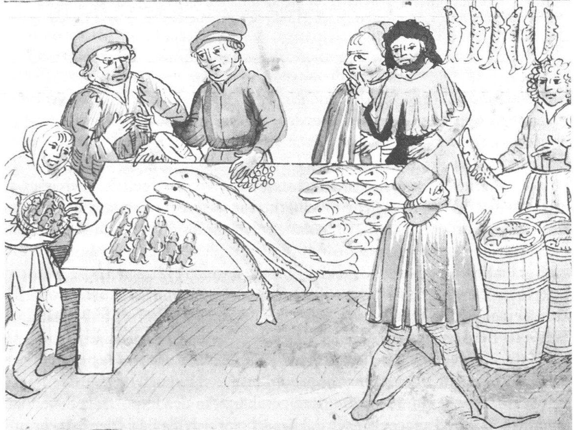
Abb. 4 Marktstände in Konstanz aus der Konzilchronik Ulrich von Richentals aus den Jahren 1414–1418. Verkauft werden nicht nur Fische und Frösche, sondern auch Schnecken, deren Herkunft allerdings unbekannt ist.