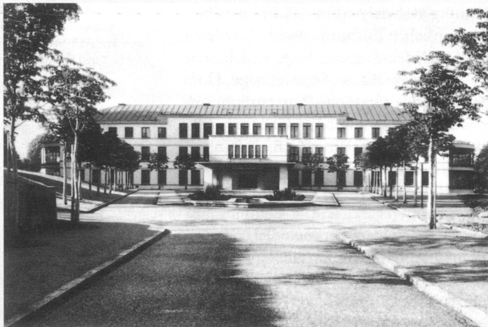
Ansicht von Norden