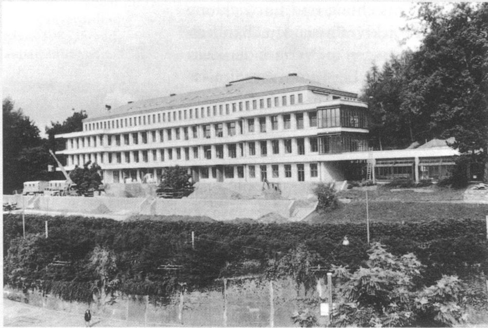
Ansicht von Süden