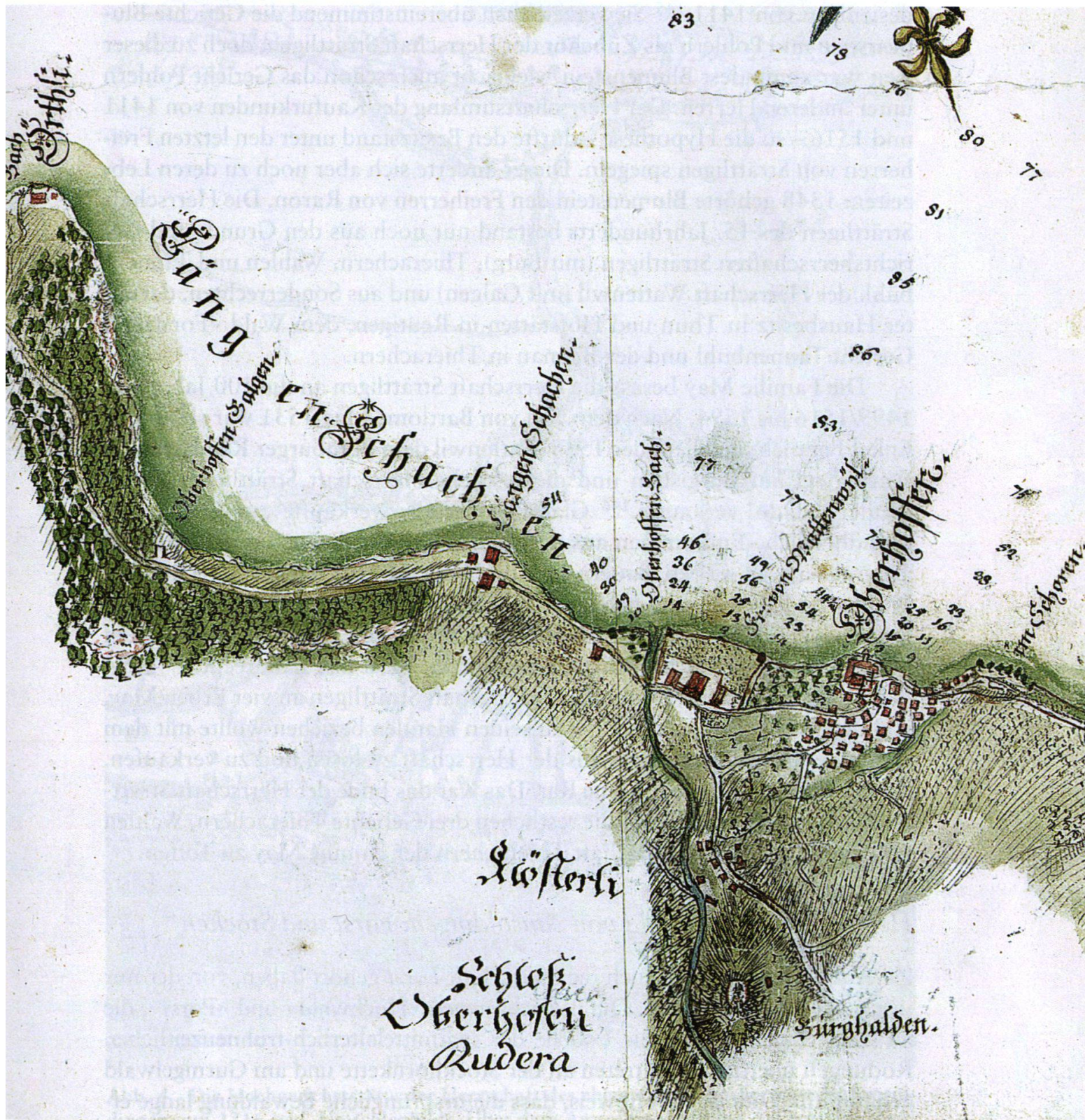
Abb. 3 Die Hochgerichtsstätte der Privatherrschaft, ab 1652 Vogtei, Oberhofen 1771. Ausschnitt aus der südorientierten Federzeichnung «Thunersee» von Geometer Johann Jakob Brenner von 1771. Der Galgen stand im Längenschachen über der Landstrasse vom Oberland nach Bern zwischen dem «Örtli» und dem Schloss Oberhofen, dem Amtssitz des bernischen Vogts, als Zeuge der lokalen Gerichts- und Herrschaftsgewalt. Oberhalb des Schlosses am See befindet sich der Hinweis auf die Ruine (Rudera) der mittelalterlichen Burg an der Burghalde.