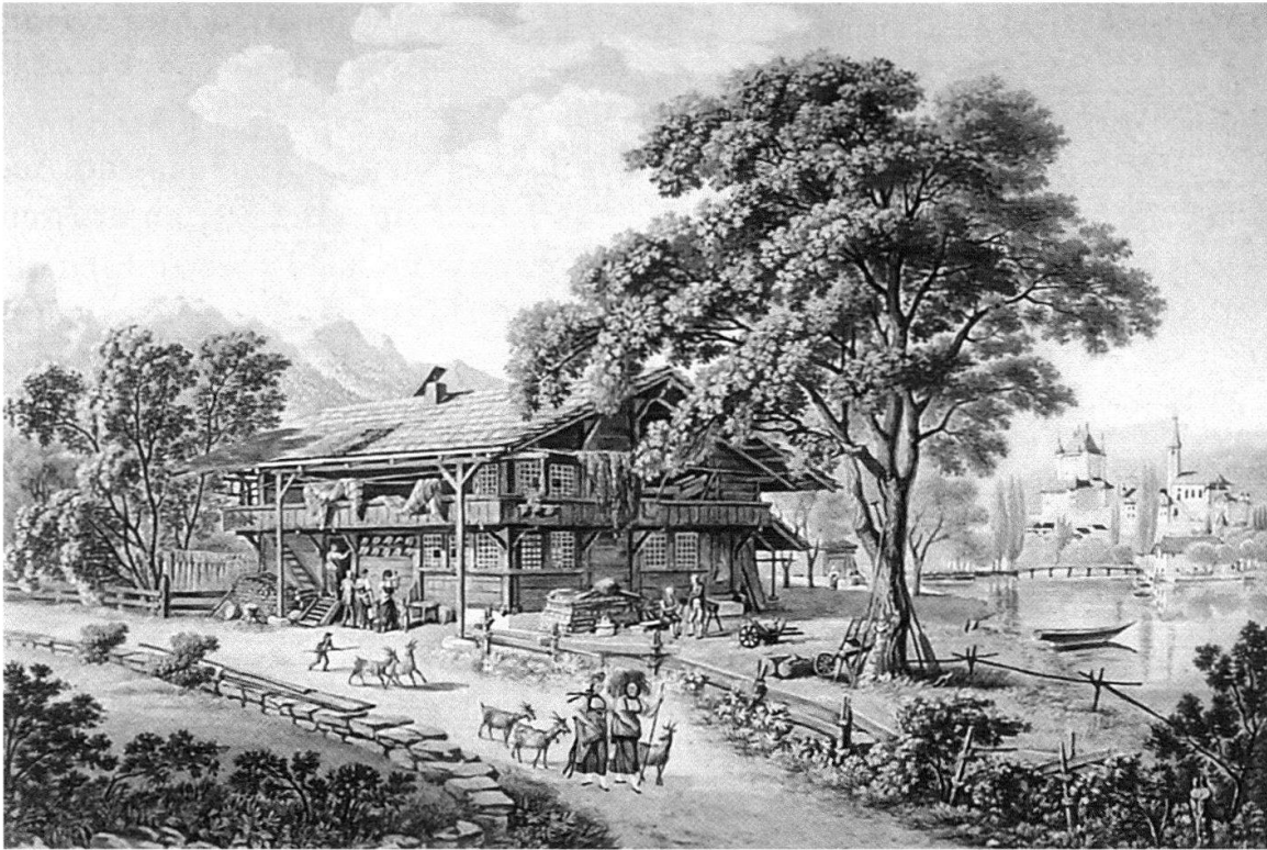
Abb. 7 Gabriel Ludwig Lory (1763–1840) bildete in den 1820er-Jahren das Fischerhaus in Scherzligen ab. Zum Trocknen aufgehängte Netze und neben der Tür angenagelte Fischköpfe weisen auf den Beruf des Hausbesitzers hin. Wie die meisten Fischer zu dieser Zeit wird er daneben wohl auch als Bauer gearbeitet haben.

sorgte dafür, dass weiterhin ein Drittel der Fische in Thun verkauft wurde. Die übrigen Fische lieferte er möglichst lebend an den Fischverwalter der Stadt Bern, für tote Fische erhielt er weniger Geld. 1784 gab die Berner Obrigkeit den Handel mit Fischen frei.