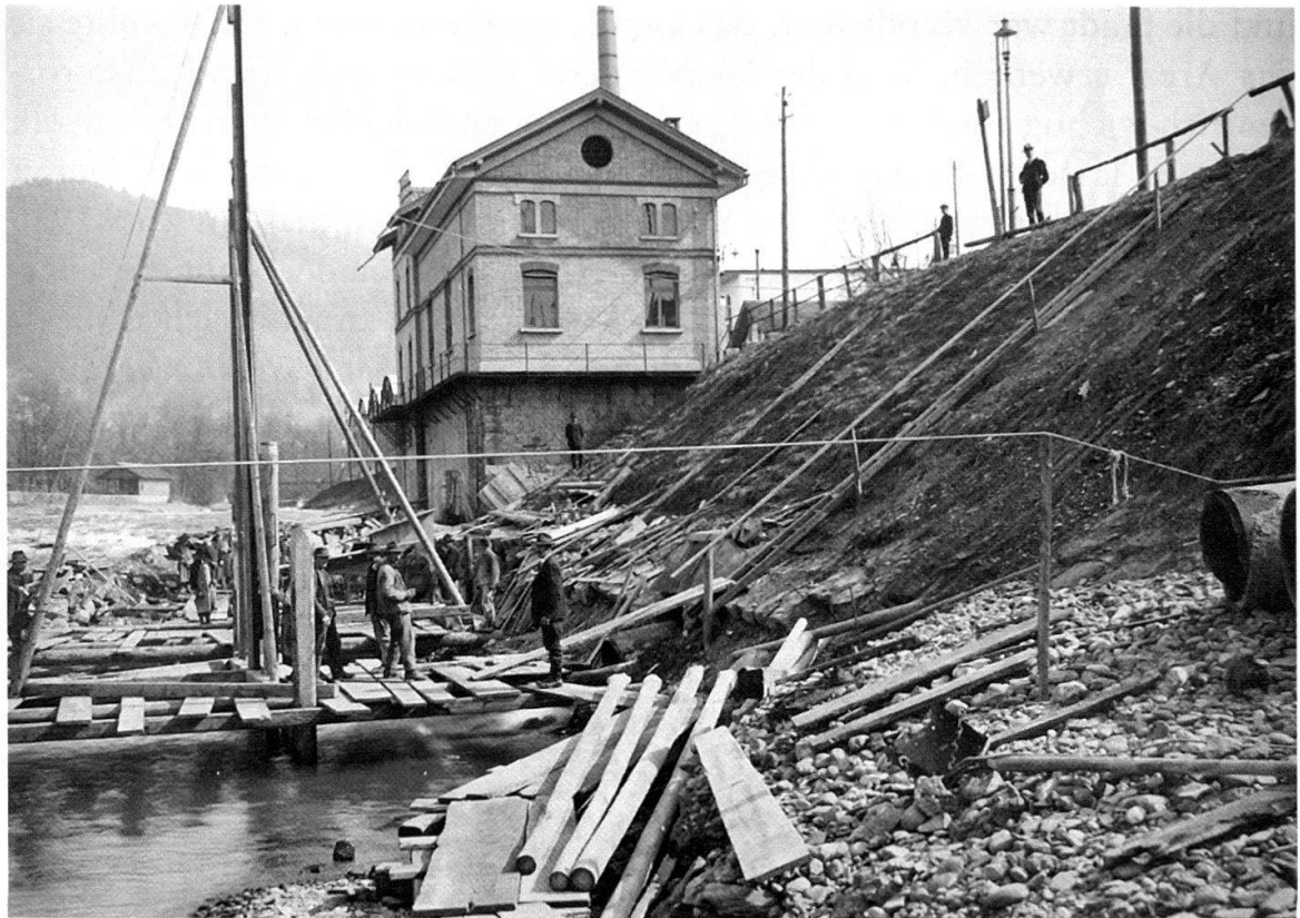
Abb. 10 Im Zentrum dieser Aufnahme von 1917 steht das erste Elektrizitätswerk, das die Stadt Thun 1895/96 an der Scheibenstrasse errichtete. Um unabhängiger von importierter Kohle zu werden, die im Ersten Weltkrieg zur Mangelware wurde, baute Thun 1917 nebenan ein weiteres Kraftwerk.

und auch unvorhergesehenen Erosion der Flusssohle durch die Aare-Zulg-Korrektion war hier das dafür nötige Gefälle entstanden.