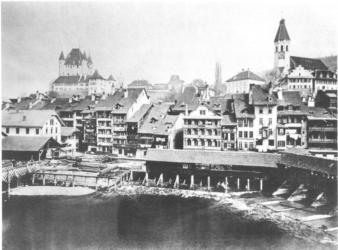
Abb. 9 Foto der Altstadt in den 1870er-Jahren. Rechts im Vordergrund befindet sich die untere Schleuse. Ganz links im Bild erkennt man unterhalb des Schlossberges die zwei Mühlegebäude, unter denen je ein Kanal durchfloss. Davor stand zudem eine Sägerei, die ebenfalls die Wasserkraft nutzte.

mit neuester Technik ausgestattet war. Es war weiterhin die Aare, welche die Energie für die Mahlwerke lieferte, allerdings nicht mehr mit Hilfe der traditionellen Wasserräder. Die neue Mühle war mit einem modernen Turbinenwerk ausgestattet, welches die Wasserkraft effizienter in mechanische Energie umsetzte. Damit war in Thun eine grosse, moderne Industriemühle entstanden, die 1886 dem eidgenössischen Fabrikgesetz unterstellt wurde und die der Konkurrenz die Stirn bieten konnte. 1889 beschäftigte die Mühle Lanzrein 13 Angestellte und gehörte zu den drei leistungsfähigsten Mühlen im Kanton Bern. Nach Adolf Lanzreins Tod wurde die Firma vorerst unter dem Namen Lanzrein's Söhne weitergeführt. 1926 fusionierte sie mit der 1900 gegründeten Firma Naef/Schneider und Cie. zur Mühlen AG, welche 1928 den Standort Thun teilweise elektrifizierte. 53