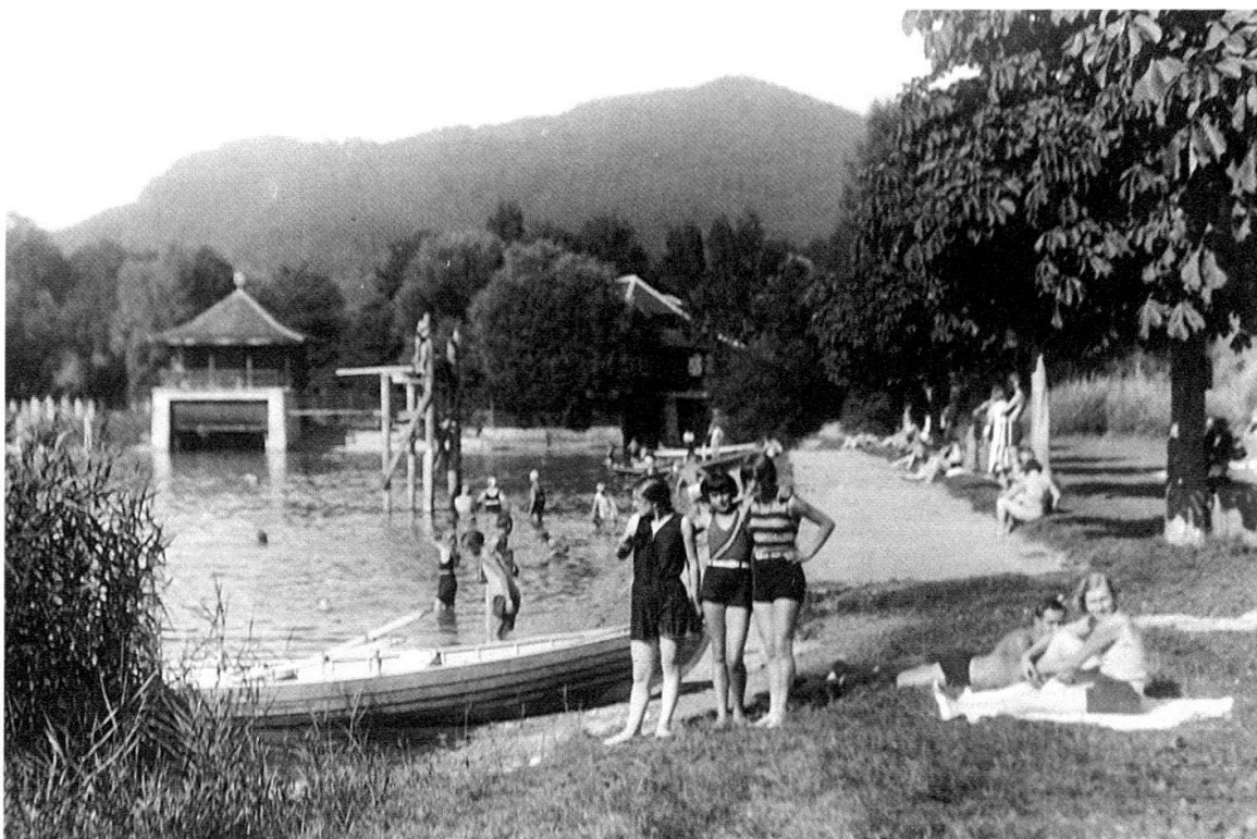
Abb. 14 Dieses Foto von 1928 hielt den Badebetrieb des ersten öffentlichen Seebads am Lachenkanal in Dürrenast fest. Während im Flussbad Schwäbis noch strikte Geschlechtertrennung herrschte, durften hier ab 1924 Männer, Frauen, Knaben und Mädchen am Wochenende gemeinsam baden.

Die Gäste der Badeanstalt im Schwäbis badeten streng nach Geschlechtern getrennt, und zwar nicht wie in vielen andern Bädern in verschiedenen