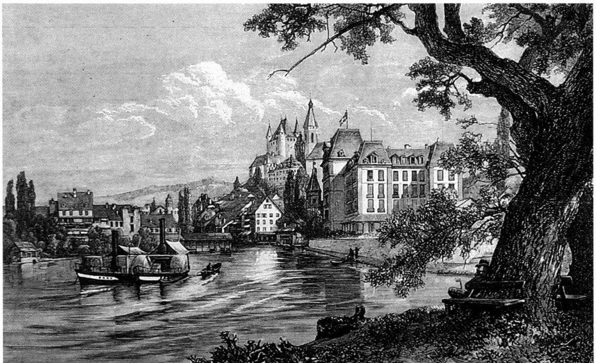
Abb. 13 Eine Aktiengesellschaft baute 1875 das Luxushotel Thunerhof. Wegen der damaligen Wirtschaftskrise und weil die Baukosten den Voranschlag massiv überschritten hatten, musste die Einwohnergemeinde den Thunerhof schon 1878 übernehmen; sie verkaufte ihn aber 1895 wieder an eine Aktiengesellschaft. 1942 erwarb die Stadt den Thunerhof zum zweiten Mal und brachte hier einen Teil der Stadtverwaltung unter. Der Stahlstich aus dem Jahr 1880 von Edward Compton (1849–1921) zeigt das Gebäude von Südosten.

Mit dem Aufschwung des Tourismus entstand ein wirtschaftlicher Druck auf dieses Quartier. In der zweiten Hälfte des 19. Jahrhunderts ent-