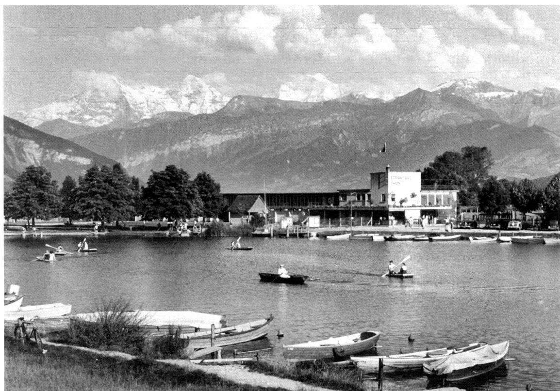
Abb. 16 Paddel- und Ruderboote auf dem Lachenkanal 1933. In diesem Jahr nahm das Thuner Strandbad seinen Betrieb auf. Im 20. Jahrhundert suchten immer mehr Menschen die Fluss- und Seeufer auf, um sich dort zu vergnügen und zu entspannen.

Auf der Aare war die Schifffahrt nach der Aare-Zulg-Korrektion nicht mehr möglich. Trotzdem gab es weiterhin einzelne Personen, die sich nicht davon abhalten liessen, den Fluss mit Booten zu befahren, allerdings nur noch als Freizeitbeschäftigung. Ein Hinweis auf solche Bootsfahrer findet sich schon 1867 in einer Thuner Zeitung. Zwei junge Engländer wollten mit einem Boot von Scherzligen via Aare, Bieler- und Neuenburgersee zum Genfersee gelangen. Ein genauerer Blick auf die Landkarte erübrigte sich jedoch, denn ihr Boot zerschellte schon an der oberen Schleuse, worauf sich die Sportsmänner schwimmend retteten und sich anschliessend im Restau-