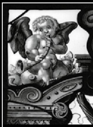
nach der Restauration

Atelier für Glasmalkunst Martin Halter Klösterlistutz 10, 3013 Bern Tel. 0 313 314 266 /Natel 079 643 15 81 / info@glasmalkunst.ch