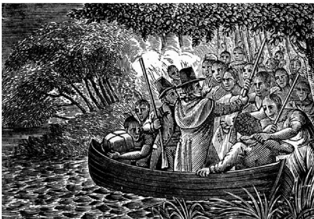
Abb. 10 Von Graffenried und seine drei Begleiter (Lawson und zwei Sklaven) werden von Tuscarora-Indianern gefangen genommen.

Noch immer hat von Graffenried den Traum von reichen Minen nicht aufgegeben. Als er 1711 deswegen mit Lawson eine Schifffahrt ins Landesinnere unternahm, wurden die beiden von den Tuscarora-Indianern gefangen genommen. Die friedliche Nachbarschaft gehörte der Vergangenheit an. Lawson wurde von den Indianern umgebracht, währenddem es von Grafenried gelang, mit ihnen einen Friedensvertrag auszuhandeln und nach mehreren Wochen freizukommen, möglicherweise auch deshalb, weil von Graffenried bereits anlässlich des Landkaufes für New Bern mit den Indianern verhandelt und ihnen eine Entschädigung bezahlt hatte. 63 Im schriftlichen Abkommen wurde nun festgelegt, dass die Kolonie nicht mehr weiter ausgebaut werden sollte, die Indianer ihr Gebiet behalten könnten und auch