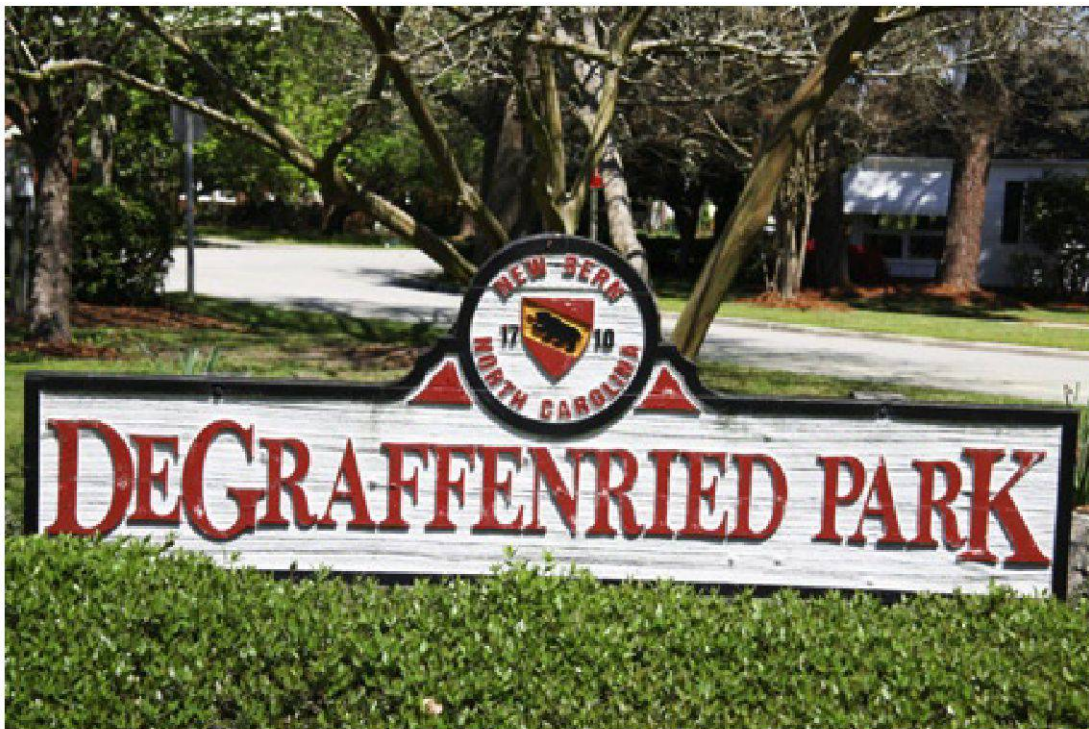
Abb. 15 Sogar ein Park erinnert an den Stadtgründer Christoph von Graffenried. – Tryon Palace Historic Sites & Gardens, New Bern.

Auch wenn die Stadt durch die Indianerkriege beinahe vollständig zerstört und der grösste Teil der Bewohner vertrieben worden war, erlebte New Bern im Verlauf des 18. Jahrhunderts nach seinem Wiederaufbau einen bemerkenswerten Aufschwung. 70 Abwechselnd mit anderen Orten wurde New Bern Hauptstadt des nördlichen Teils der Kolonie Carolina (ab 1729 North Carolina). 1766 machte der königliche Gouverneur William Tryon New Bern definitiv zur Kapitale der Kolonie und liess in den folgenden Jahren den heute noch bestehenden Tryon Palace erbauen. Im Sezessionskrieg spielte New Bern nur eine untergeordnete Rolle, auch wenn North Carolina in