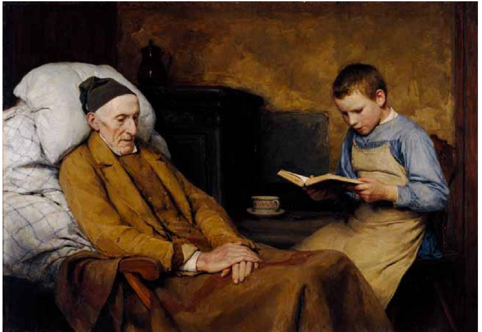
Albert Anker, Die Andacht des Grossvaters, 1893, 63 x 92 cm. Kat. Nr.483. – Kunstmuseum Bern.