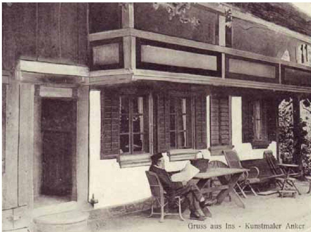
Albert Anker liest Zeitung. Postkarte Gruss aus Ins – Kunstmaler Anker, um 1900 [Ausschnitt].