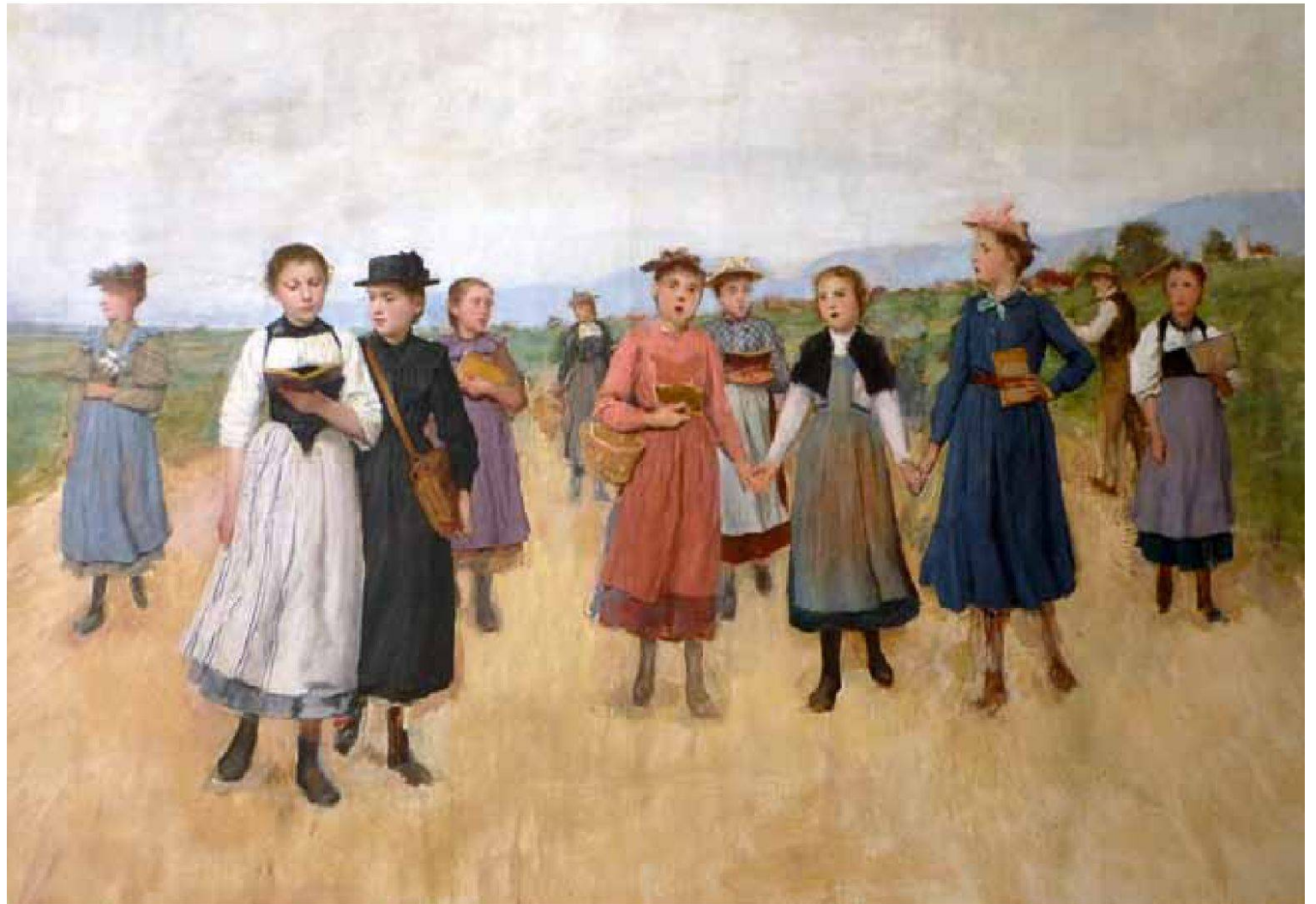
Albert Anker, Die Konfirmandinnen von Müntschemier, 1901, Öl auf Leinwand, 86 x 131 cm, Kat. Nr. 584. – Gemeinde Ins.