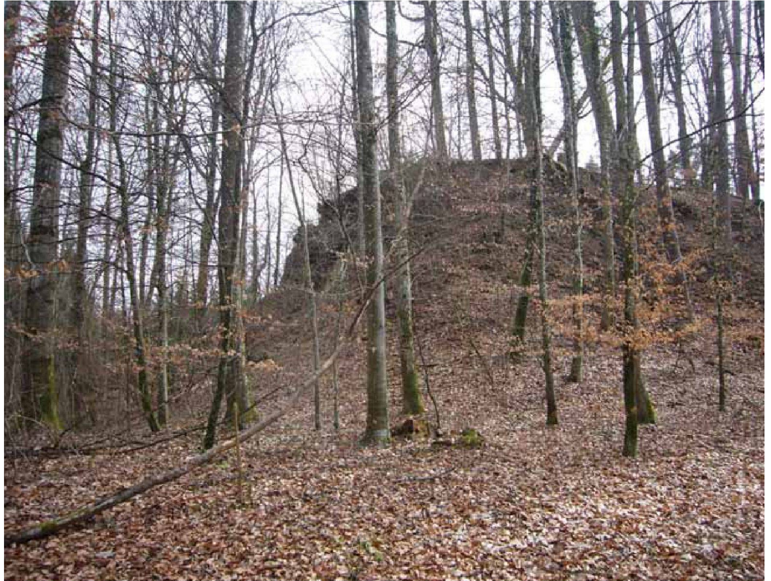
Ruine der Burg Alt-Bubenberg bei Frauenkappelen.