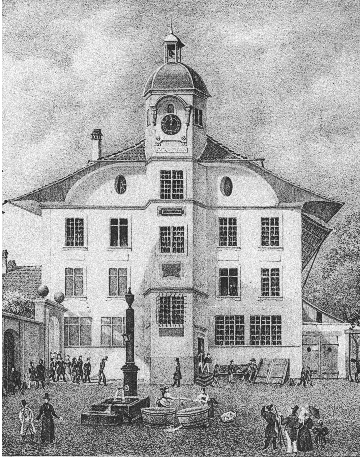
Die Akademie in Bern. – Durheim, Charles (1810–1890), Lithographie. Burgerbibliothek Bern.