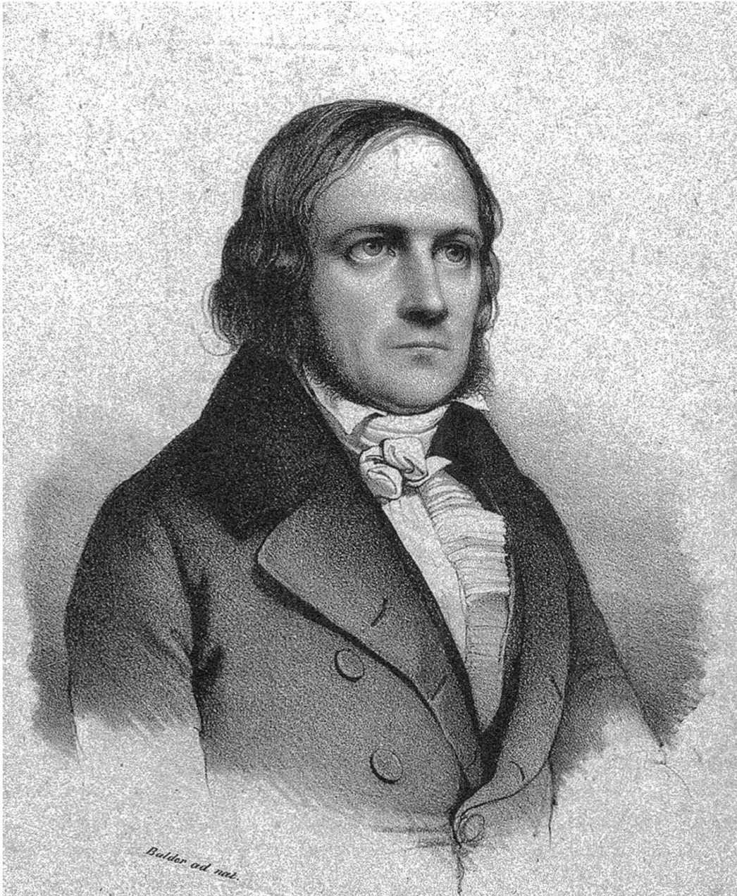
Wilhelm Snell (1789–1851). – Georg Balder, Lithographie.