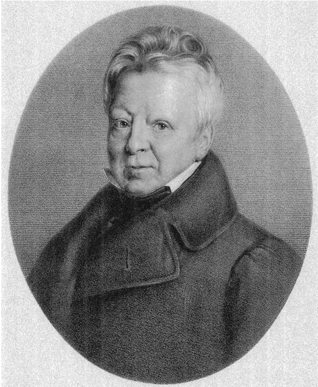
Samuel Ludwig Schnell (1775–1849). – Lithographie. Staatsarchiv Bern.