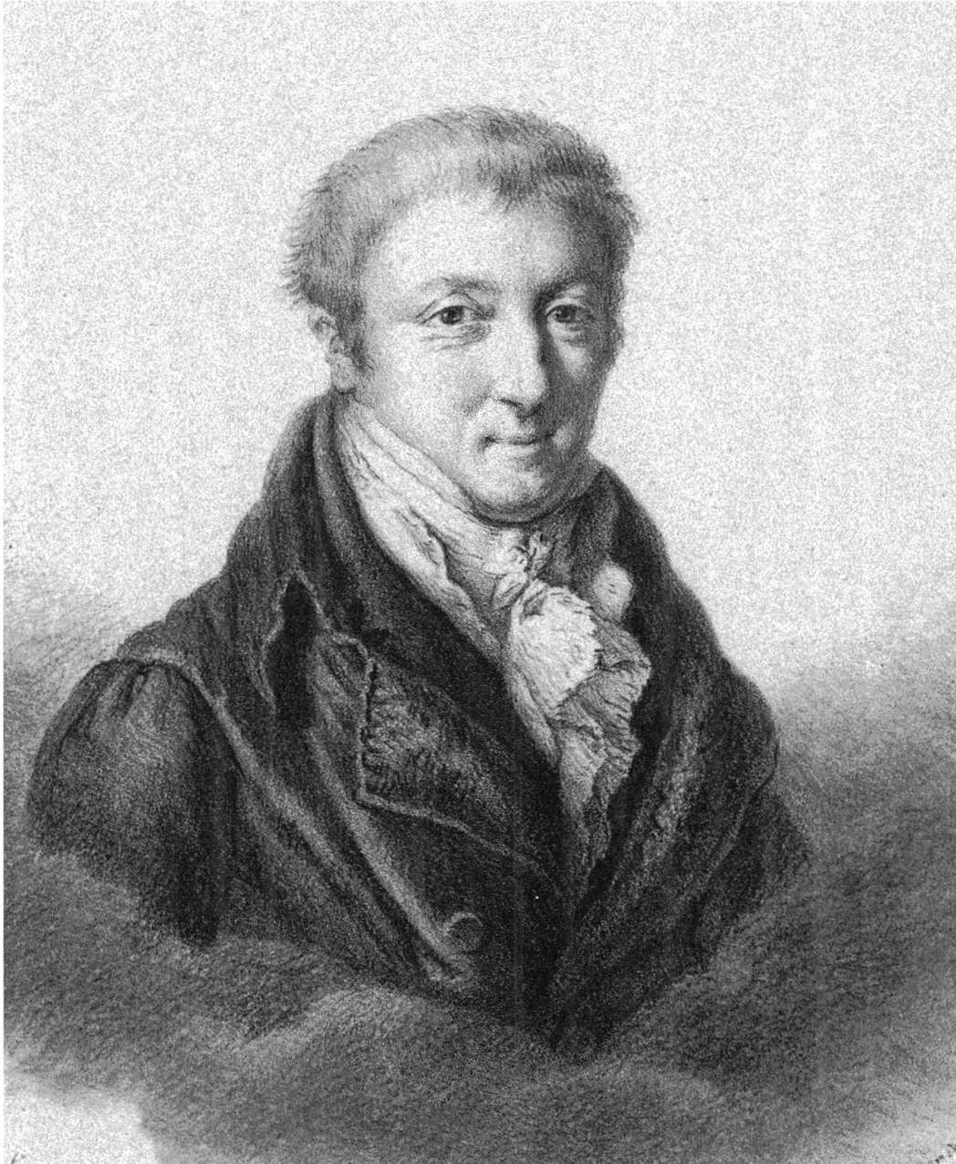
Carl Ludwig von Haller (1768–1854). – Lithographie.