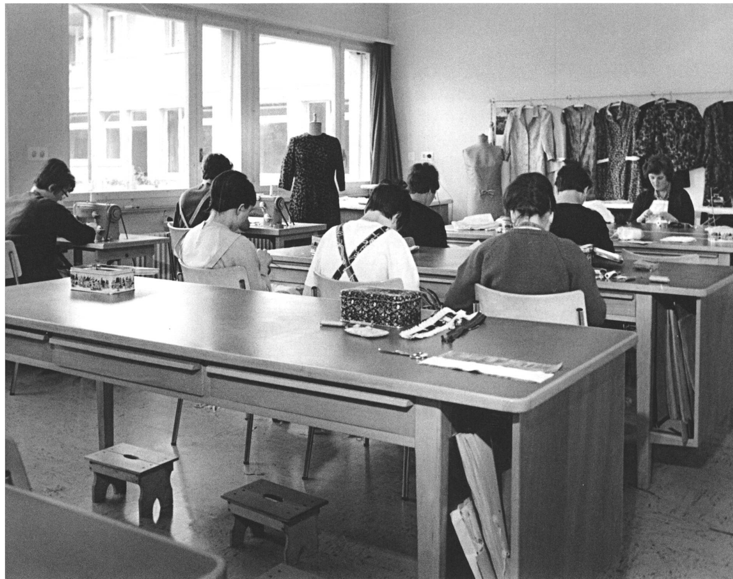
Abb. 7: Loryheim, Münsingen, nach 1960. Das Loryheim bot den eingewiesenen Mädchen beschränkte Ausbildungs- und Beschäftigungsmöglichkeiten wie die Arbeit in der Gärtnerei oder eine Lehre in typischen Frauenberufen wie Haushälterin oder Schneiderin.