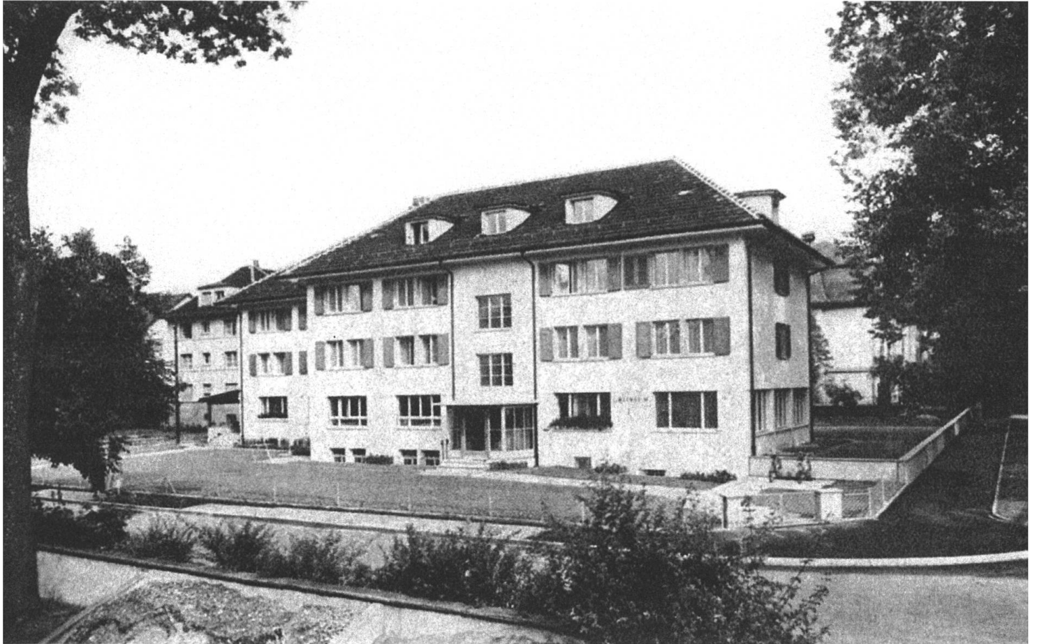
Abb. 4: Durchgangsheim Heimgarten, Neubau von 1956. Das Heim im Berner Obstbergquartier wurde 1911 gegründet. Von Beginn an diente es dazu, «gefährdete» oder «gefallene» junge Frauen ab 15 Jahren auf den richtigen Weg – sprich in die bürgerliche Ehe – zurückzuführen. Ab den 1950er-Jahren bezeichnete sich das Heim als «Durchgangsheim», das kurzfristige Versorgungsfunktionen für Justiz- und Fürsorgebehörden übernahm. Nach 1972 wurde die Einrichtung zu einem Beobachtungsheim mit Aussenwohngruppen weiterentwickelt. – Die Illustrierte der Neuen Berner Zeitung , 2.9.1956.