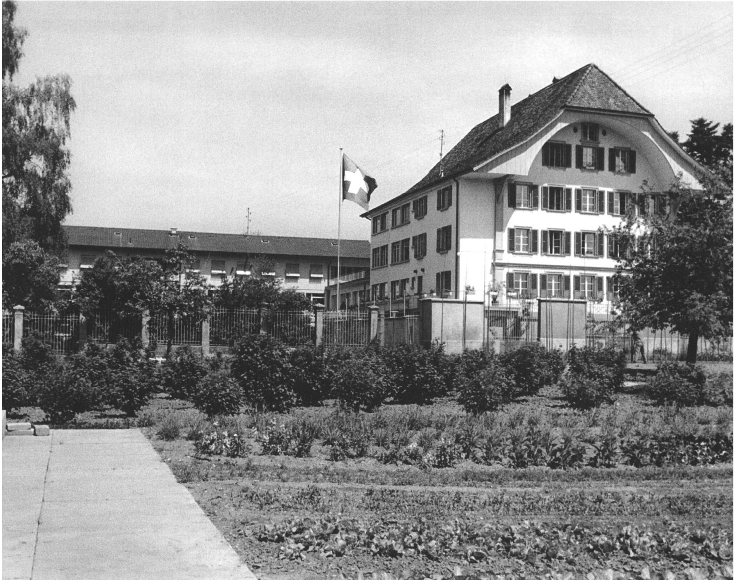
Abb. 6: Loryheim, Münsingen, nach 1960. 1935 eröffnete der Kanton Bern ein Heim für Mädchen. Das Loryheim nahm als geschlossene Einrichtung strafrechtlich verurteilte und administrativ versorgte junge Frauen auf. Zwischen 1960 und 1965 wurden neue Gebäudetrakte erstellt und das bestehende Bauernhaus umgebaut.