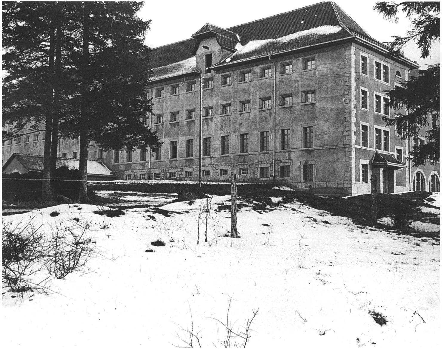
Abb. 5: Jugendheim Tessenberg, ca. 1925. 1920 verlegte der Kanton Bern die frühere Zwangsarbeitsanstalt von Trachselwald nach Prêles auf dem Tessenberg. Die Anstalt nahm fortan sowohl strafrechtlich verurteilte als auch administrativ oder vormundschaftlich versorgte männliche Jugendliche auf. In den 1970er-Jahren wurden die Gebäude saniert und die pädagogischen Konzepte dem gewandelten Erziehungsverständnis angepasst, um die im Strafgesetzbuch festgelegten neuen Anforderungen für Spezialanstalten zu erfüllen.