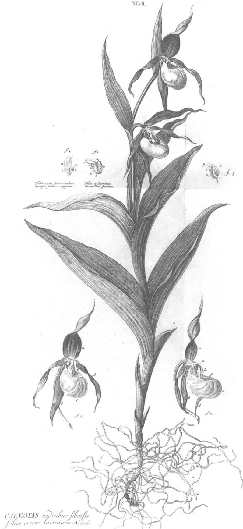
Cypripedium calceolus . Sabot de Vénus. – Haller, Albrecht von: Historia stirpium indigenarum Helvetiae inchoata . Bernae [Berne] 1768. Gravure de Johann Joseph Stoercklin. Universitätsbibliothek Bern, MUE KpIII 137.