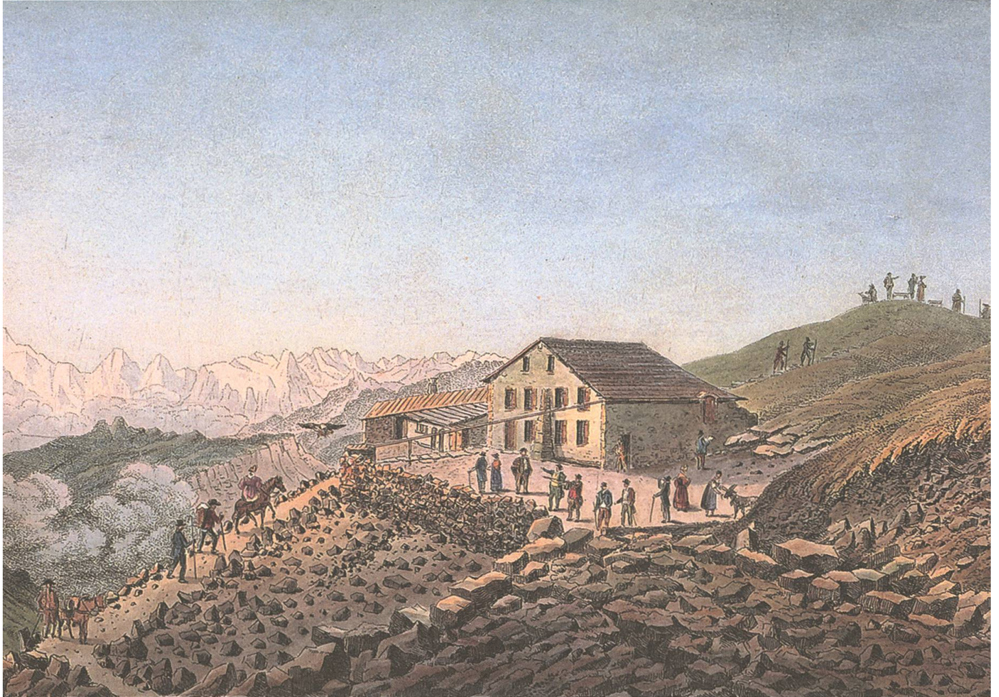
Grindelwald, Hotel Faulhorn. «Vue de l'auberge du Faulhorn la plus haute habitation de l'Europe élevé 8140 pieds». Kolorierte Aquatinta von Samuel Weibel. – Wehrl, Martin: Faulhorn. Unterseen 2003, 20.