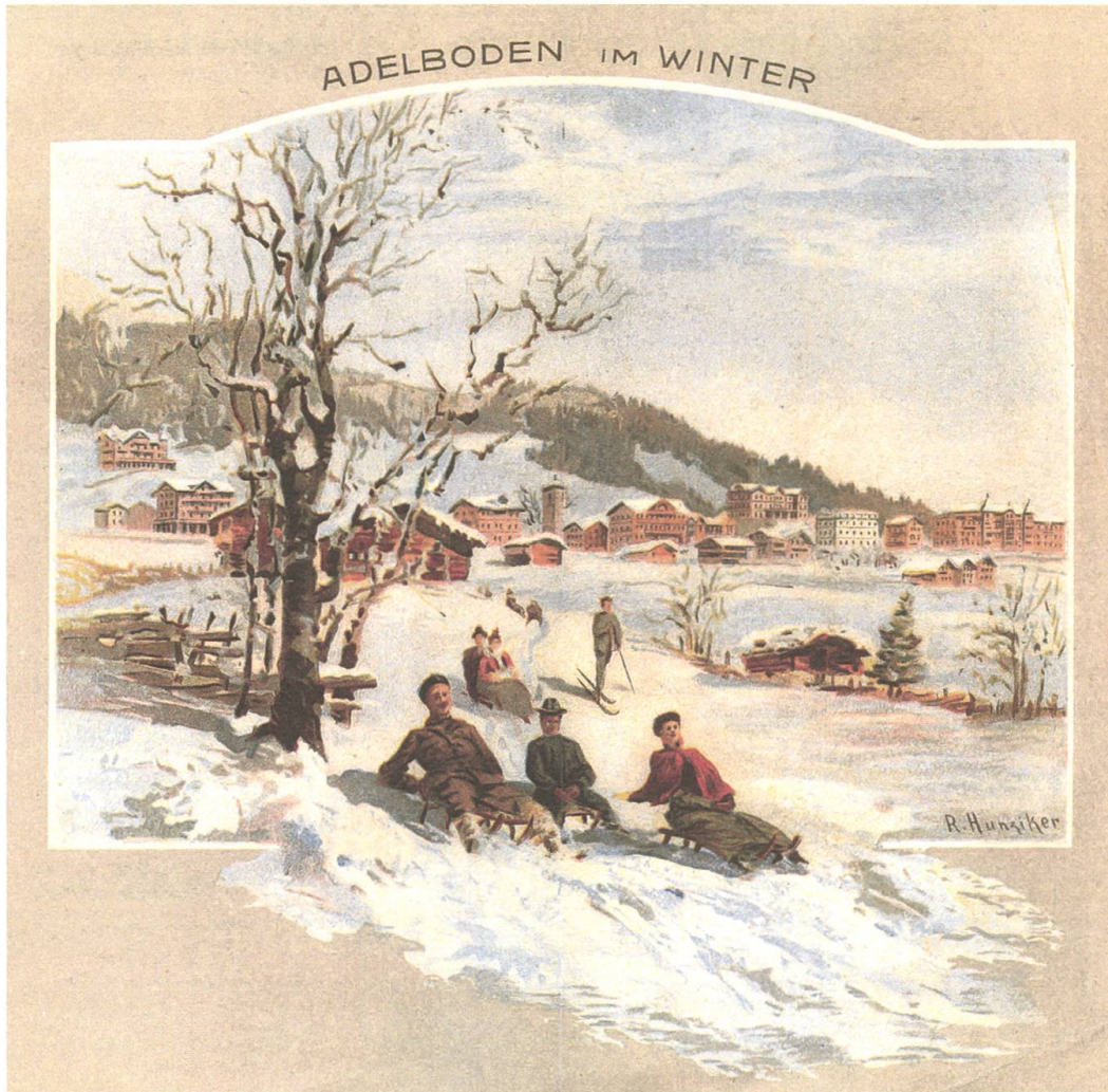
Adelboden im Winter. Mit der Eröffnung der ersten Wintersaison im Dezember 1901 gehörte Adelboden zu den Wintersportpionieren im Berner Oberland. Werbeprospekt für die erste Wintersaison.