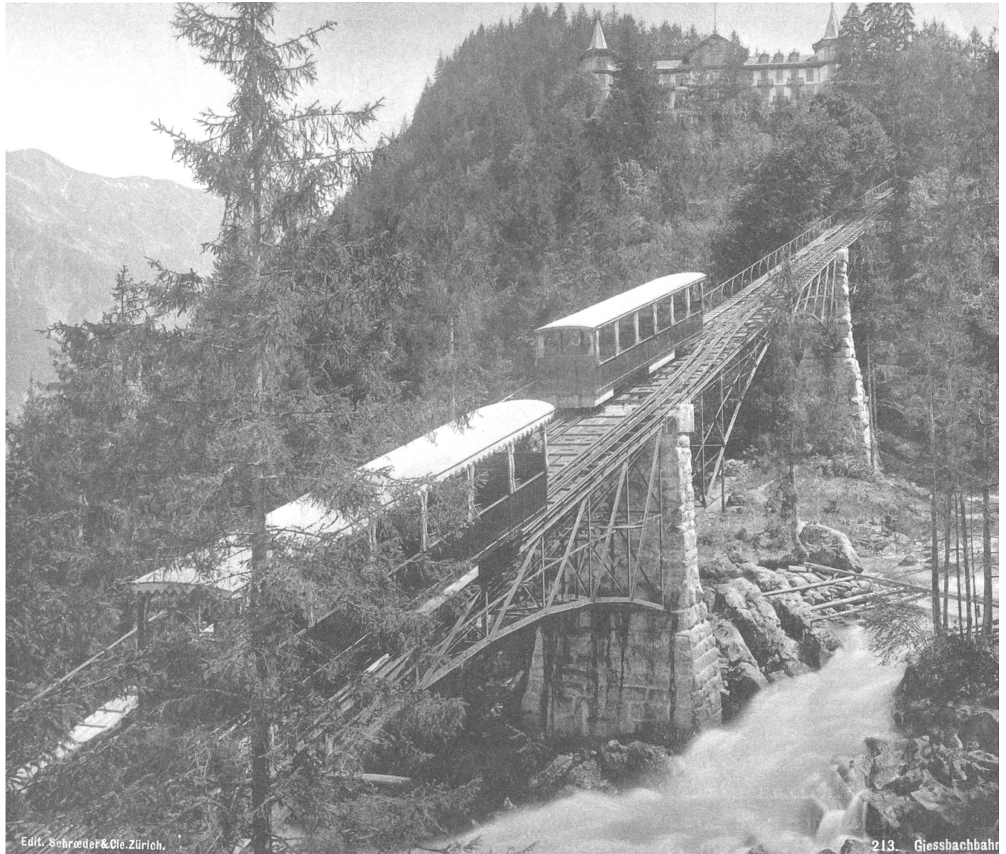
Brienz, Grandhotel Giessbach. Die Giessbachbahn verband als erste Hotelbahn der Schweiz seit 1879 die Schiffsstation mit der Hotelanlage. Foto um 1890 mit den beiden sich auf der automatischen Ausweiche kreuzenden Wagen. Im Hintergrund ist das nach dem Brand 1883 durch den Architekten Horace Edouard Davinet wieder aufgebaute Hotelgebäude sichtbar.