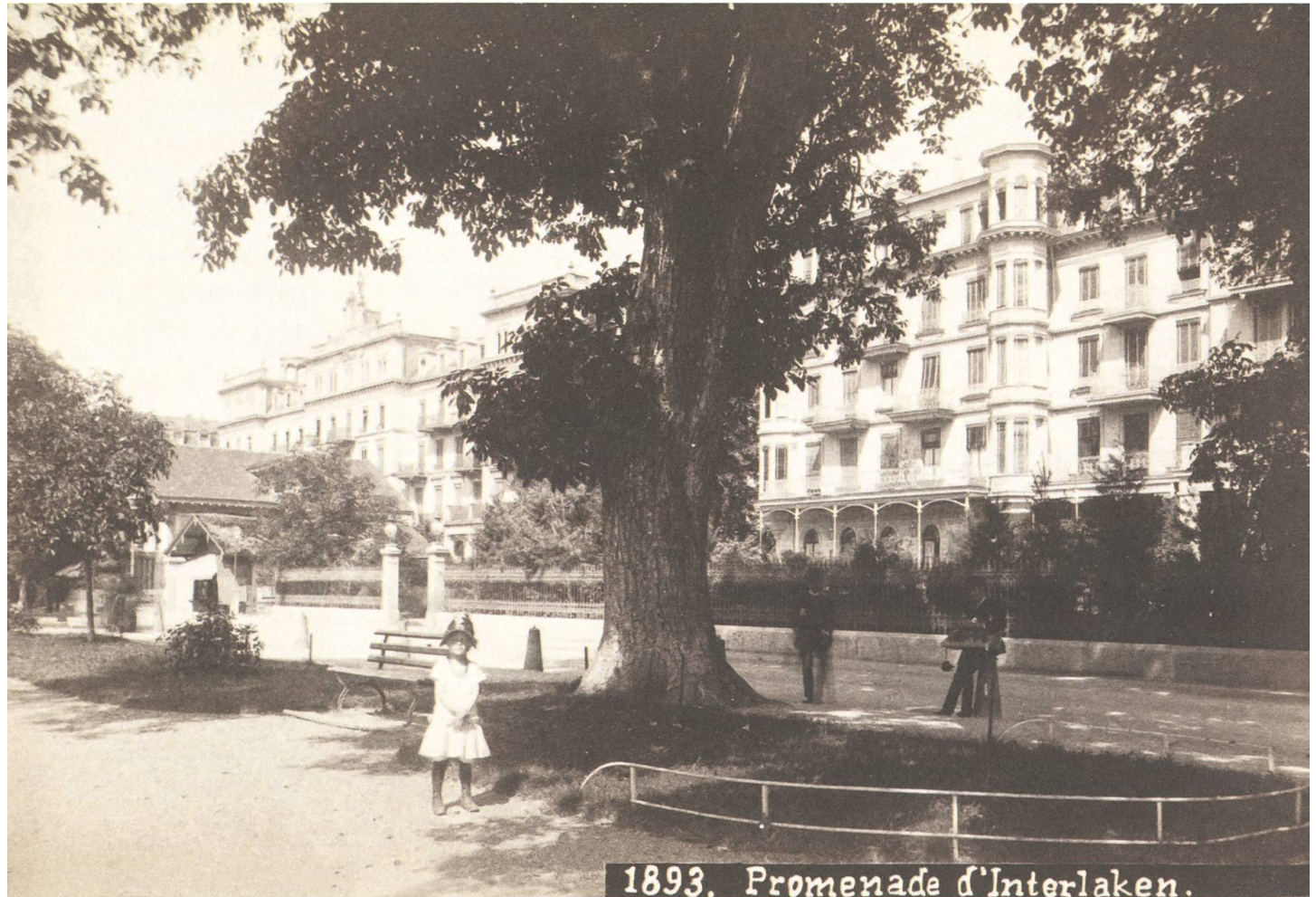
Interlaken, Höhweg mit den beiden 1865 eröffneten Hotels Victoria (links) und Jungfrau. Das Hotel Jungfrau weist bereits den 1883 erbauten Westflügel auf. Fotografie von Johann Adam Gabler um 1890. – ETH-Bildarchiv Ans 12351 .