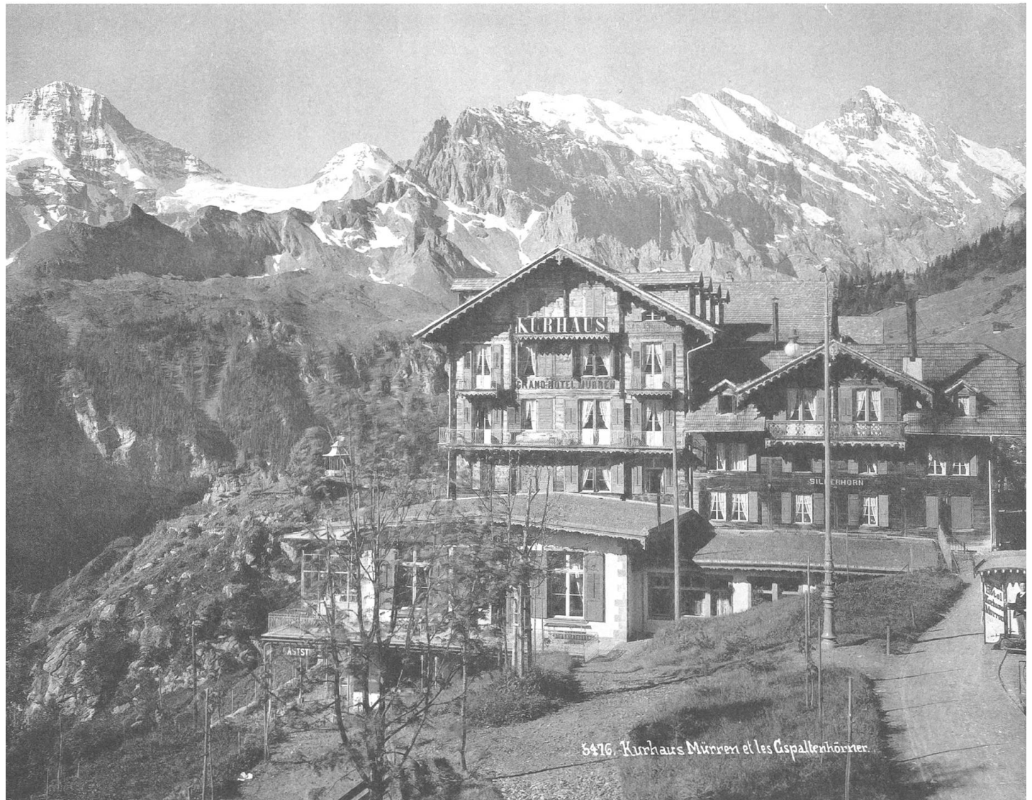
Müren, Grand Hôtel Müren & Kurhaus. Ansicht der imposanten Hotelanlage um 1900. Das eigene Pferdetram holte die Hotelgäste seit 1894 am Bahnhof ab.