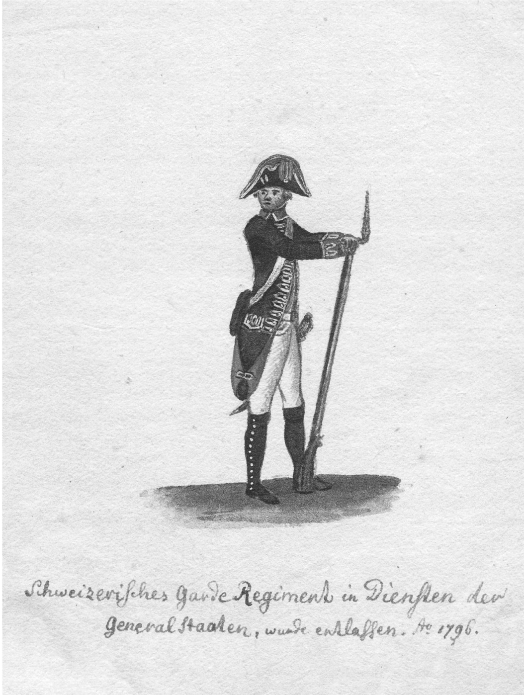
Uniform des Schweizer Garderegiments im holländischen Dienst 1795. – Uniformhandschrift Streuli, 1798–1800, Heft 11, S. 167, Abb. 126. Schweizerisches Nationalmuseum LM-178895,163.