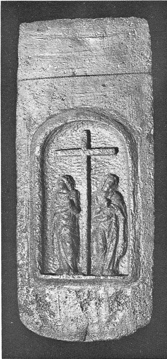
Abb. 2 Antiker Ziegel mit gefälschtem Modelldruck. Abgesehen davon ist es eine ikono- graphische Unmöglich- keit, dass sich Maria und Johannes vom Kreuz abwenden.

gen haben mittlerweile als Originale geltend Eingang in die Literatur gefunden. Vom gleichen Sammler ist auch bekannt, dass er für sich spasseshalber antiken Firstreitern Kronen aufgesetzt und ihnen Glasaugen oder Zungen eingesetzt hat. War dieser Sammler ein Fälscher? (4)