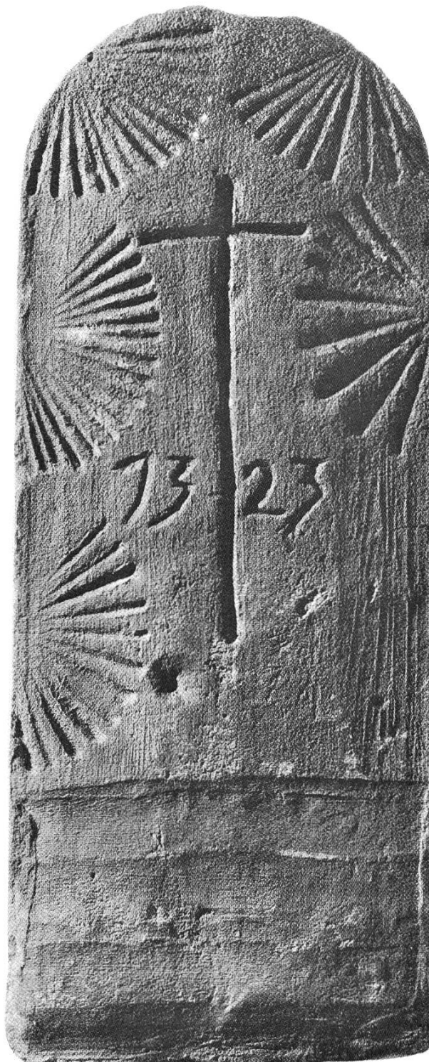
Abb. 1 Ziegel mit der Zahl 13 23

2. Ein leidenschaftlicher Sammler versuchte, im Wettstreit mit anderen Sammlern, seine eigene Ziegelkollektion aufzuwerten, indem er alte, unverzierte Ziegel ausgeschabt und mit einem Ziegelmehl-Leimgemisch eigene Modelldrucke eingesetzt hat. (3) (Abb. 2 und 3) Diese Nachschöpfun-