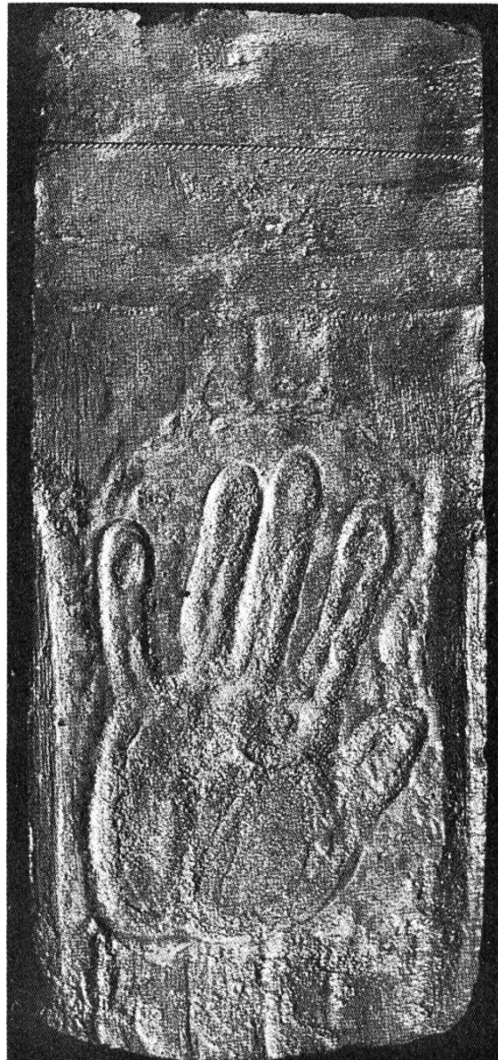
Abb. 3 Ausgeschabter, antiker Ziegel mit gefälschtem Handabdruck.

1. Der Ziegel mit der Inschrift 1323 ist keine Fälschung, weil nicht nachgewiesen werden kann, dass er zum Zwecke der bewussten Täuschung eine Inschrift trägt, die mit seinem übrigen Erscheinungsbild nicht übereinstimmt. Hier liegt vielmehr eine Fehlinterpretation der Inschrift vor, die in der Unkenntnis stilistischer Beurteilung von Ziegeln begründet ist. Versuchen wir zuerst, den Ziegel losgelöst von der Inschrift zu datieren. Rundschnitte können gelegentlich vor 1500 auftreten, besitzen aber ausschliesslich geglättete und meistens glasierte Oberflächen. Die vorliegende Ziegeloberfläche wurde mit nassen Händen längs abgezogen. Man hat sie nicht eigentlich geglättet, wie das vor