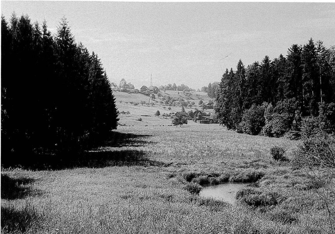
Biotop bei der Ziegelhütte 1996.

Mit der zunehmenden Globalisierung steht es um das ursprüngliche Ziel, ein «Schweizerisches» Ziegelei-Museum aufzubauen, zunehmend schlechter. Müssen auch wir unsere Zäune weiter stecken? Schaffen wir das, personell und finanziell? Bisher war es richtig, sich an der eigenen Umgebung zu orientieren. Unsere Stärke ist die Sachkompetenz. Damit stehen wir europaweit einmalig da. Wir sind nicht nur eine Sammelinstitution, sondern ein Expert-Center für Ziegelfragen. Das belegen uns immer wieder die Anfragen – auch aus dem Ausland. Wir pflegen diesen Austausch (z. B. Vortrag von L. Tonezzer zum Thema Ziegelöfen in Konstanz) und sind offen für Anregungen von aussen. Der Rahmen hingegen ist eng gesteckt. Betreffend Museum werden immer wieder Standorte geprüft. Die Realisierungschancen sind derzeit aber gering, wenn uns nicht jemand von sich aus willkommen heisst.