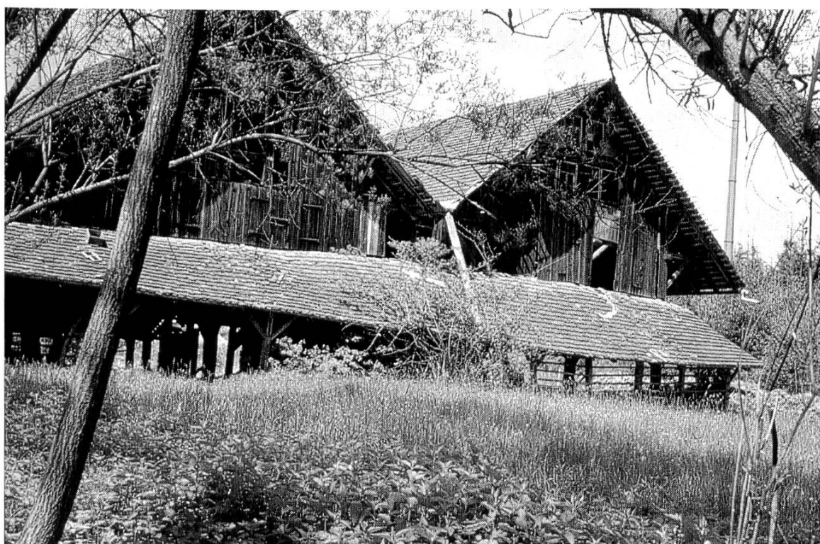
Ziegelhütte 1978.