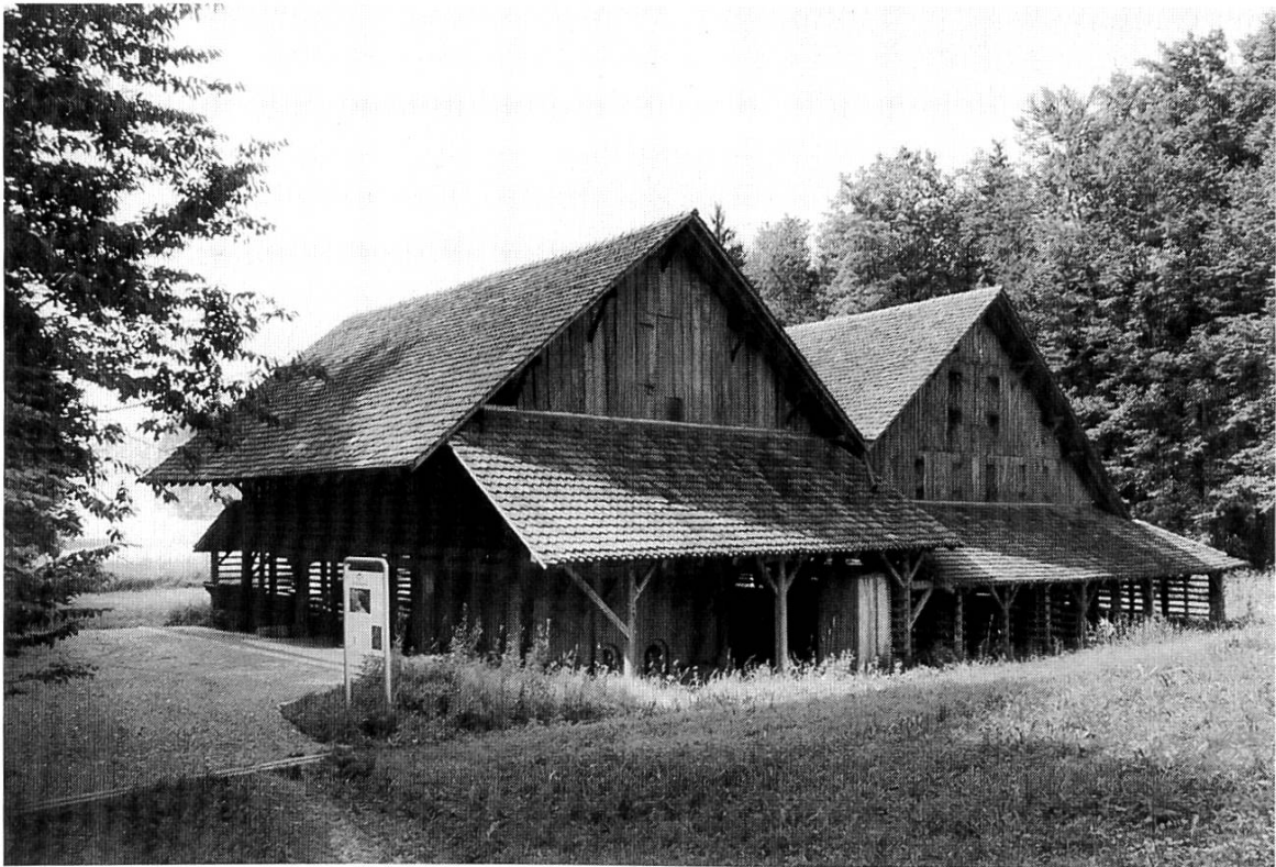
Ziegelhütte 1996 am Industrielehr- pfad

Der Einwohnerrat hielt einen Subventionsansatz der Einwohnergemeinde Cham von 15% angemessen. Beschluss-Antrag lautete: