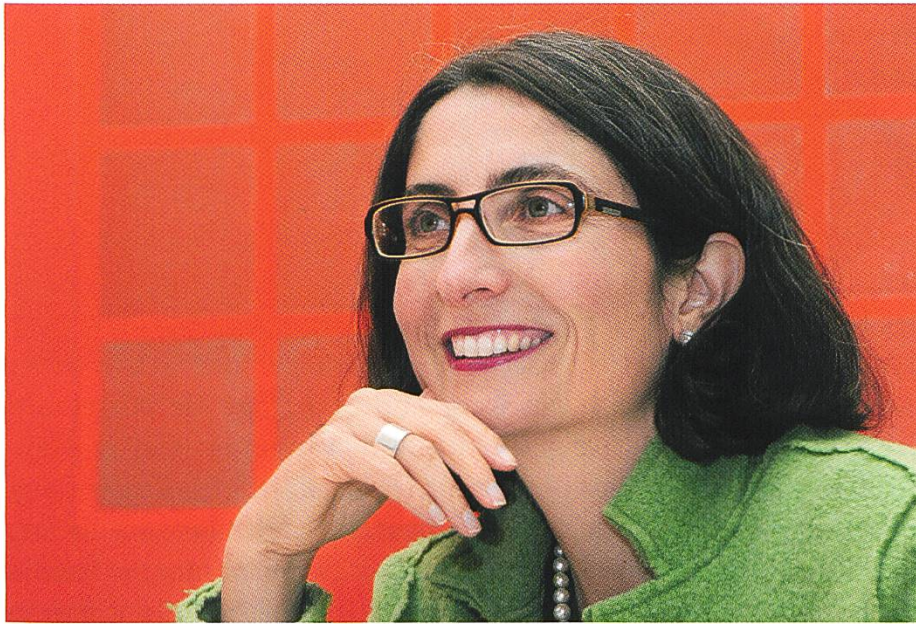
Manuela Weichelt-Picard Regierungsrätin des Kantons Zug, Direktion des Innern.

Als die Stallscheune 1982 abbrannte, war der «Dreiklang» der Gebäude zerstört. Bis Phönix aus der Asche kam, hat es einige Anläufe, viel Energie und Arbeitsstunden auch von Freiwilligen gebraucht. Mit dem Neubau des Museums als Ersatz für die abgebrannte Stallscheune wurde das ursprüngliche Ensemble wieder hergestellt. Diese Ergänzung ist weit mehr als bloss eine denkmalpflegerische Massnahme. Der Neubau ermöglicht zusammen mit dem Wohnhaus einen modernen Museumsbetrieb.