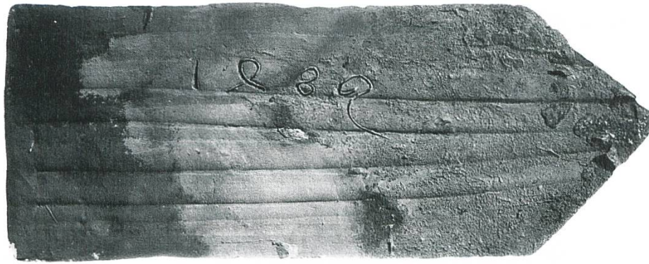
Zug, Museum in der Burg: ältester inschriftlich datierter Dachziegel der Schweiz mit der Jahreszahl 1489.

Behörden und Politik sowie ein äusserst grosszügiger Mäzen haben das Museum gemeinsam mit dem Einsatz von vielen Freiwilligen aus unterschiedlichsten Disziplinen und Aufgabenbereichen ermöglicht. Ihnen allen danke ich ganz herzlich auch im Namen des Zuger Regierungsrates.