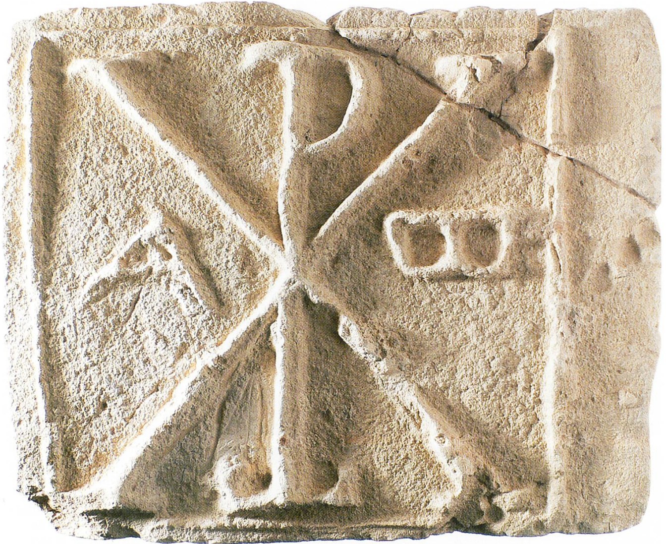
Wandfliese ZM 8299: Breite 37 cm, Höhe 30,5 cm, Dicke 3,5 cm. Zusammen mit dem überstehenden Relief ergibt sich eine Stärke von 4,3 bis 4,9 cm; unmasstäblich.