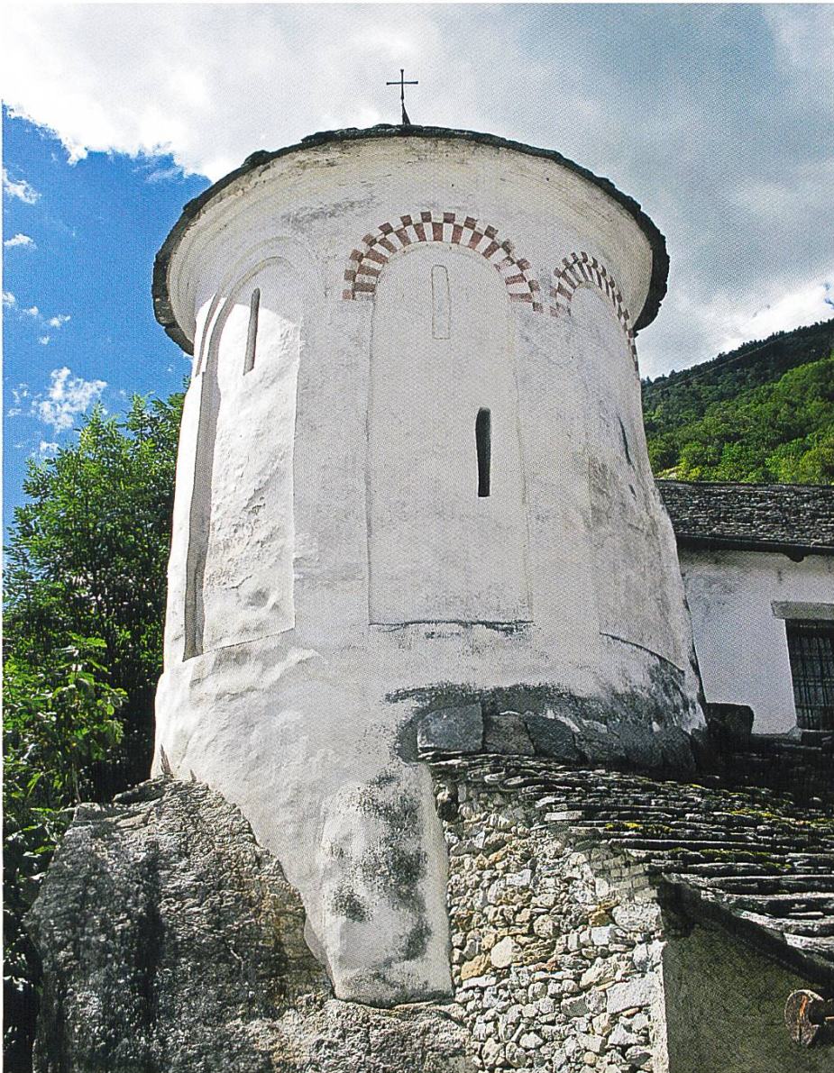
oben: San Vittore GR, San Lucio, karolingischer Rundbau mit gemalter Backsteinimitation aus der Bauzeit, Zustand 2011.