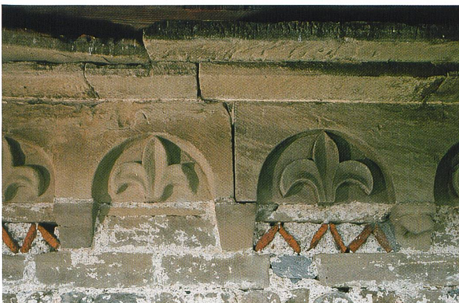
unten: Rüeggisberg BE, ehemaliges Cluniazenser- priorat, Backsteindekor um 1100.