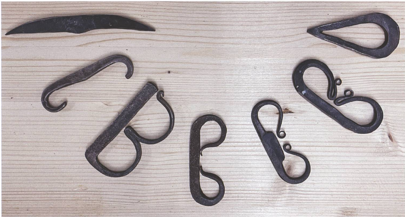
Abb. 5 Repliken verschiedener Feuerstähle; Vorlagen Frühmittelalter bis Neuzeit.

Mit Sicherheit belegt ist diese etwa durch die Erwähnung in der naturalis historia bei Plinius dem Älteren. 12 Die ersten Feuerstähle, welche sich typologisch an den auf dem Ziegel verwendeten Stahl anlehnen, tauchen im Frühmittelalter auf. 13 Die über die folgenden Jahrhunderte auftretenden Formen sind sehr unterschiedlich, scheinen aber kaum einer typologischen Entwicklung unterworfen zu sein, da die Form zweckgebunden ist (Abb. 5). Vor allem im 18. und 19. Jahrhundert entstehen aber Feuerstähle, welche vielfältigere Formen annehmen und teilweise auch multifunktional sind. Besonders in den Ländern der Habsburgermonarchie sind in der Biedermeierzeit Feuerstähle mit einem Messinggriff in zoomorpher Form verbreitet (Abb. 6). 14 Bis heute wird der Feuerstahl zum Feuermachen genutzt, in den westlichen Ländern aber nur noch im Kontext des Outdoor-Lifestyles, im Reenactment 15 oder in der Geschichtsvermittlung. 16