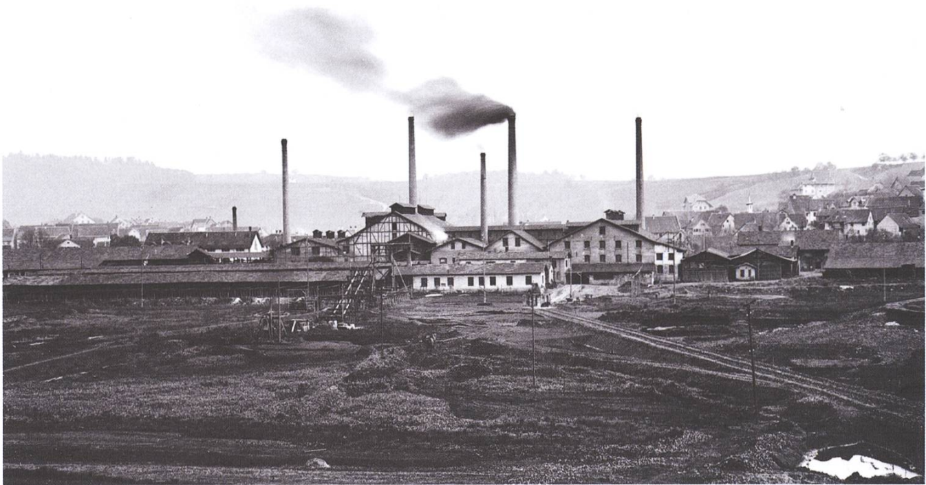
Abb. 6 Die 1889 erbaute Ziegelfabrik Thayngen, aufgenommen 1905.