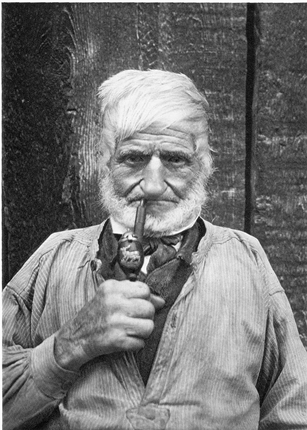
Hundertjähriger Junggeselle † in Marmorera (Graubünden)

Célibataire de 100 ans † à Marmorera (Grisons)