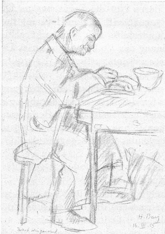
Alter Knecht beim Essen. Vieux domestique au repas.

rische Volksversicherung mit einheitlicher Regelung ist nur auf der Basis sehr niedriger Prämien- und Rentenansätze, welche den einfachen Lebensverhältnissen der Bevölkerung der Gebirgsgegenden angemessen sind, möglich. Auf dieser Grundlage würden dann kantonale, Betriebs- und andere Versicherungskassen allen oder einzelnen Bevölkerungsschichten eine Zusatzversicherung bie-